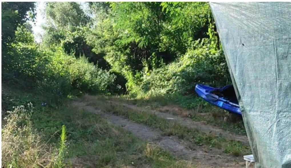
Vizitura talalkozopont csanadpalota osszes