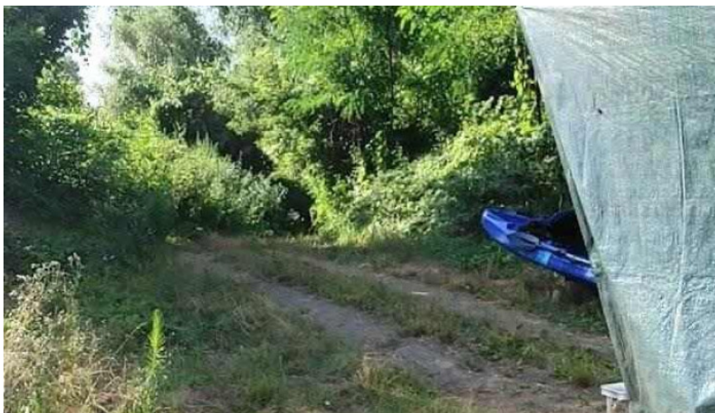
Vizitura találkozópont csanadpalota csanadpalota