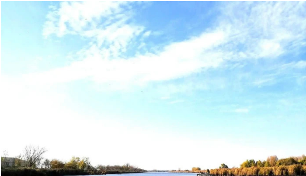
Cibakhazi holt tizza kedvezmenyek