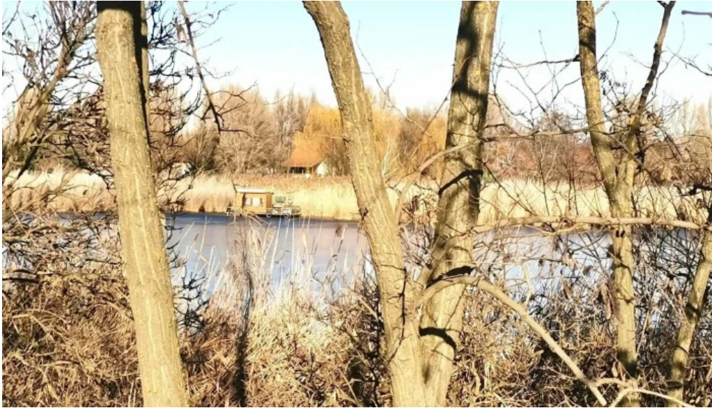
Cibakhazi holt tiszta to