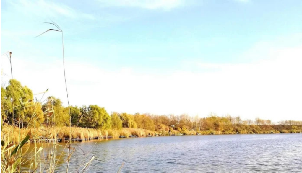
Cibakhazi holt tiszta weboldal