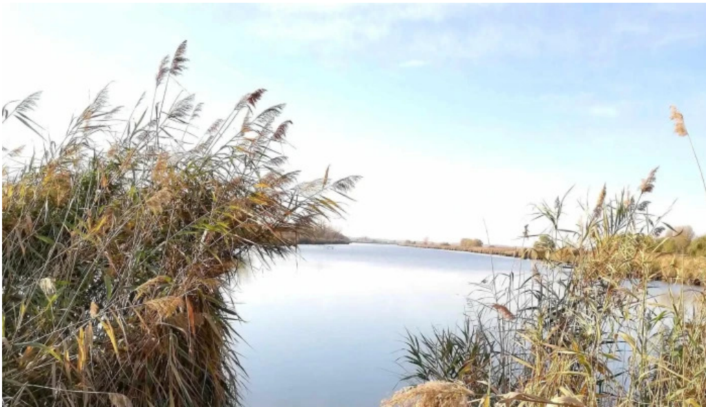
Cibakhazi holt tiszta hogyan lehet odajutni