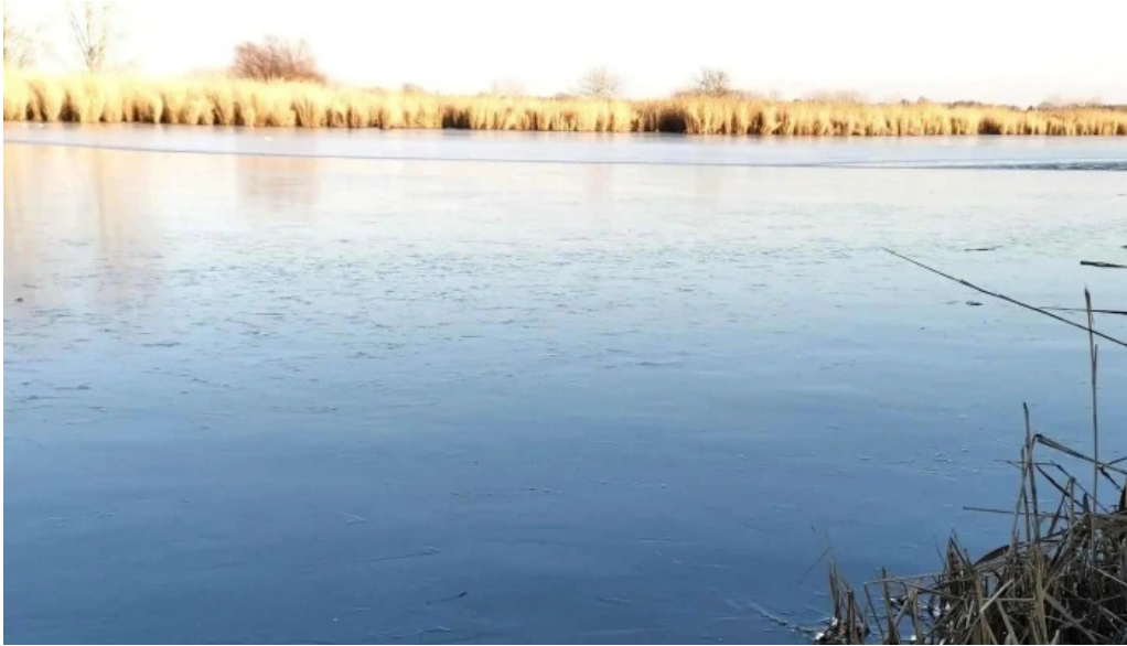
Cibakhazi holt tiszta hungary