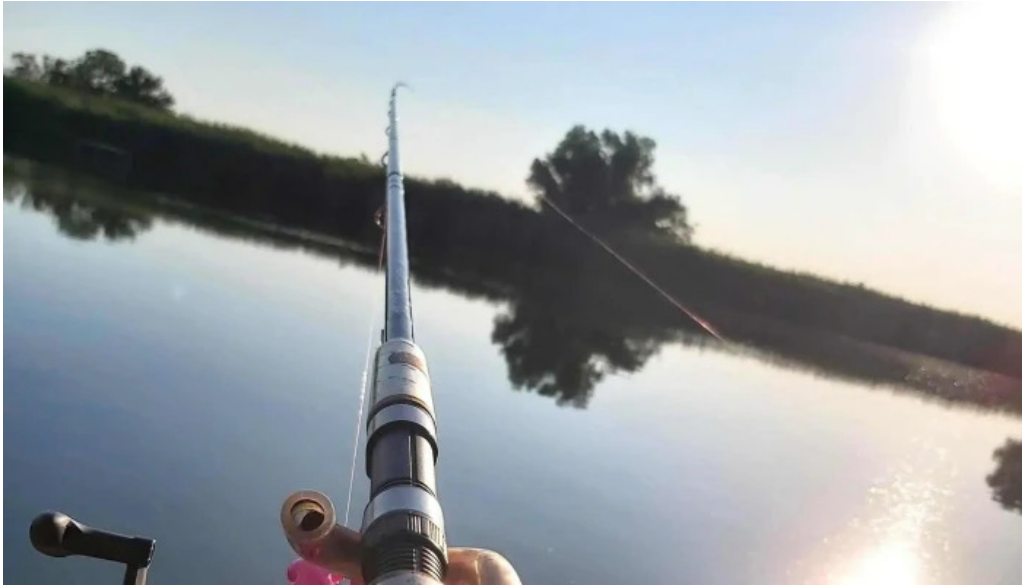
Cibakhazi holt tizza menetrend