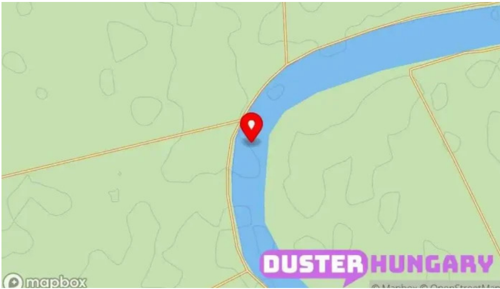
Cibakhazi holt tiszta térkép