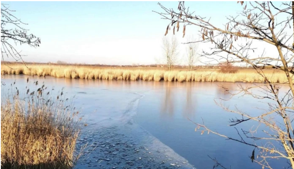
Cibakhazi holt tiszta szam