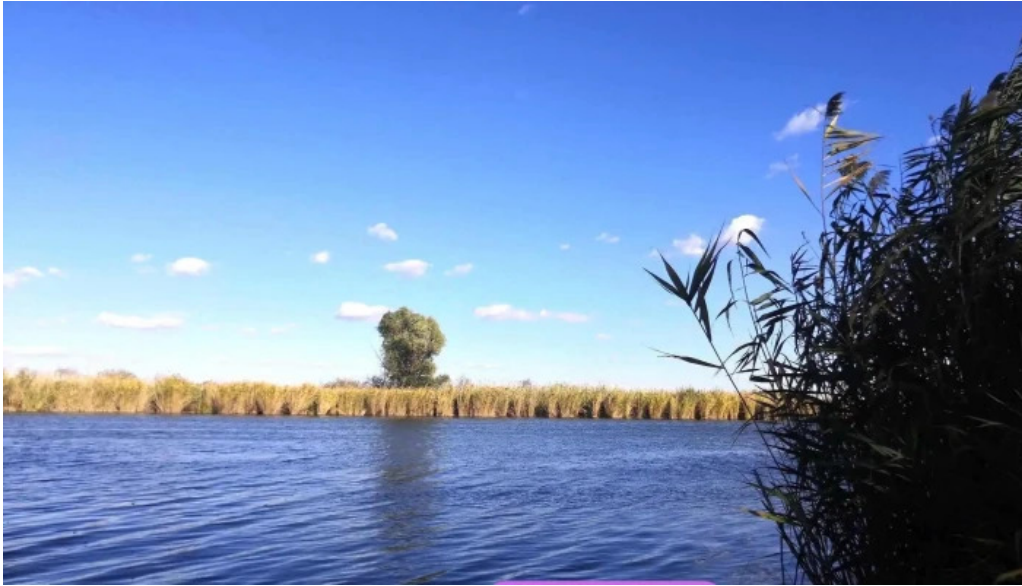
Cibakhazi holt tisza osszes