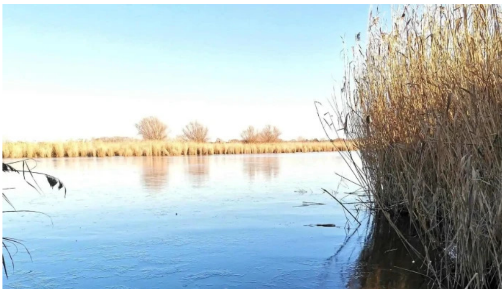
Cibakhazi holt tiszta értékelek