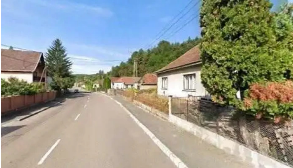
Pihenj meg apartman utcakep es 360deg