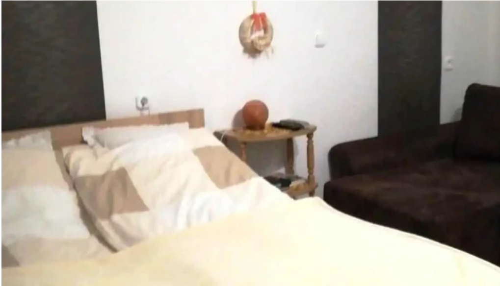
Pihenj meg apartman szobak