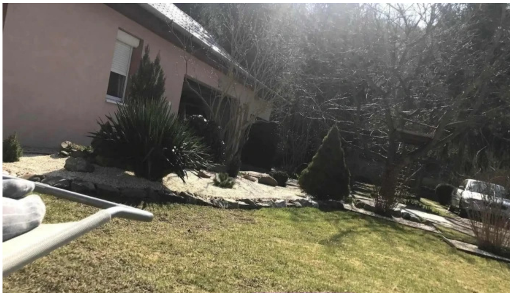
Pihenj meg apartman latogatoktol