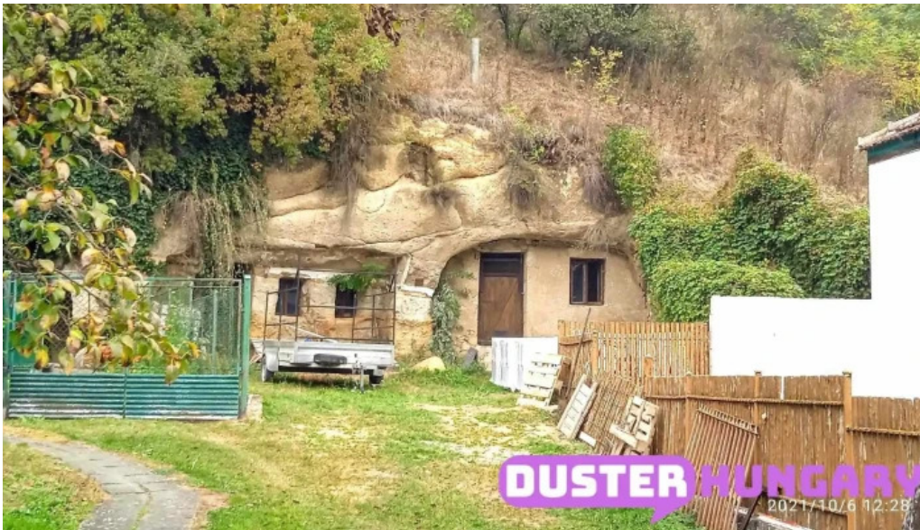
Pihenj meg apartman sirok