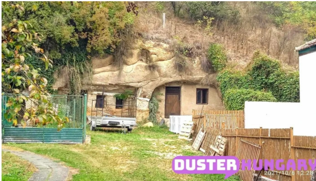
Pihenj meg apartman osszes