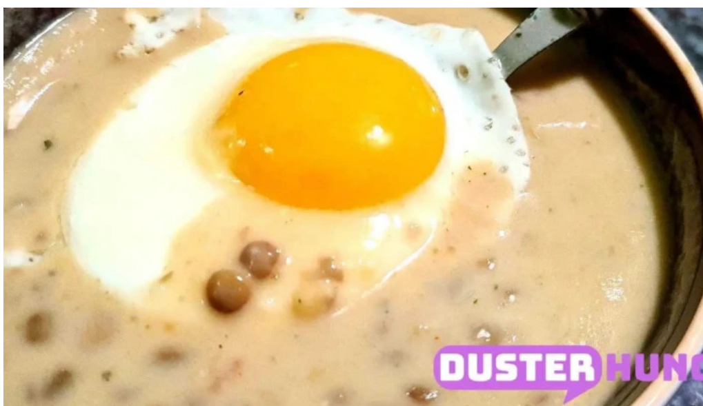
Pihenj meg apartman etel ital