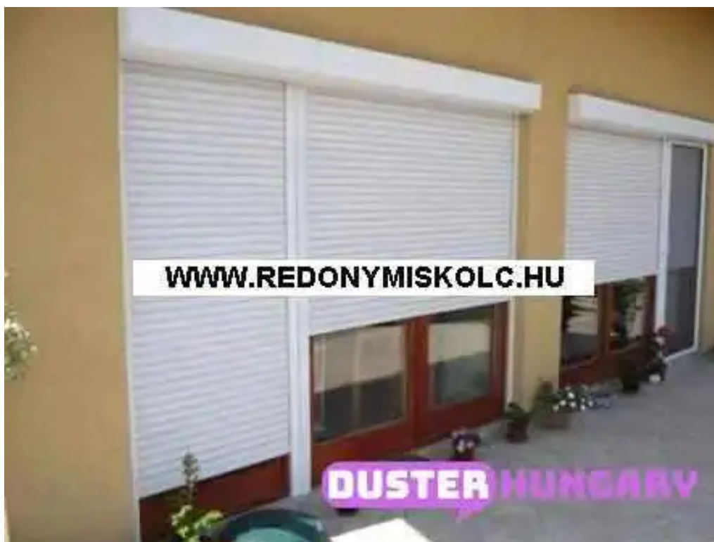
Liptak arnyekolastechnika a tulajdonostol