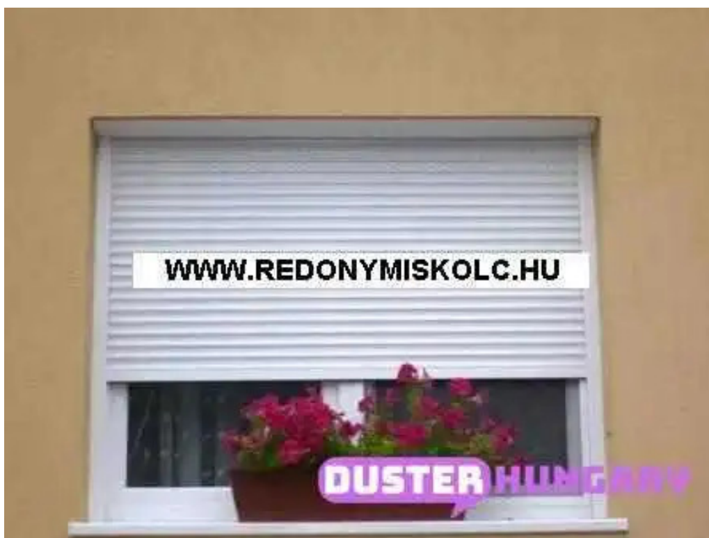
Liptak arnyekolastechnika osszes