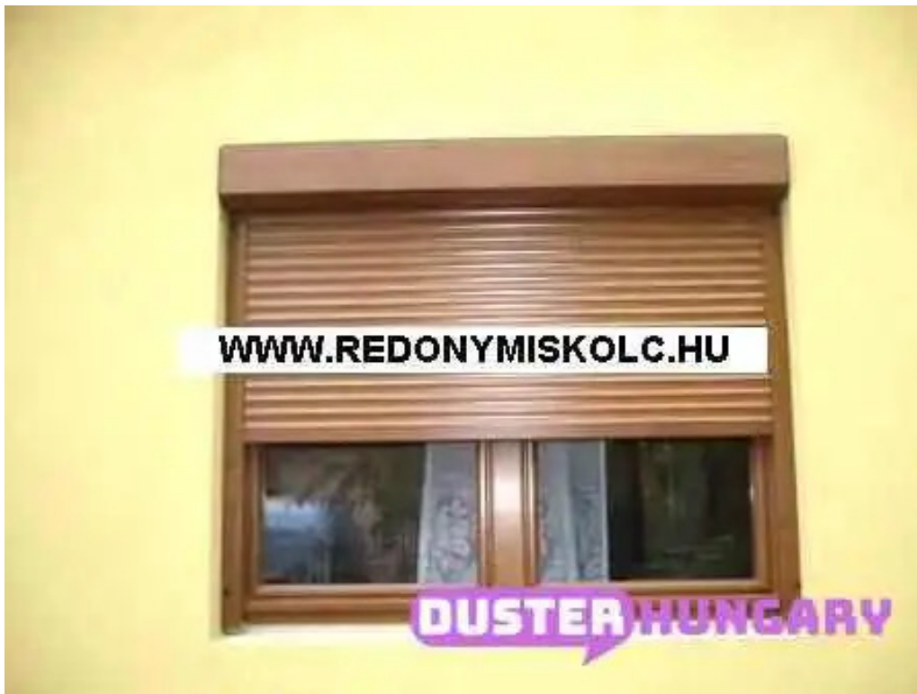
Liptak arnyekolastechnika fels?zsolca