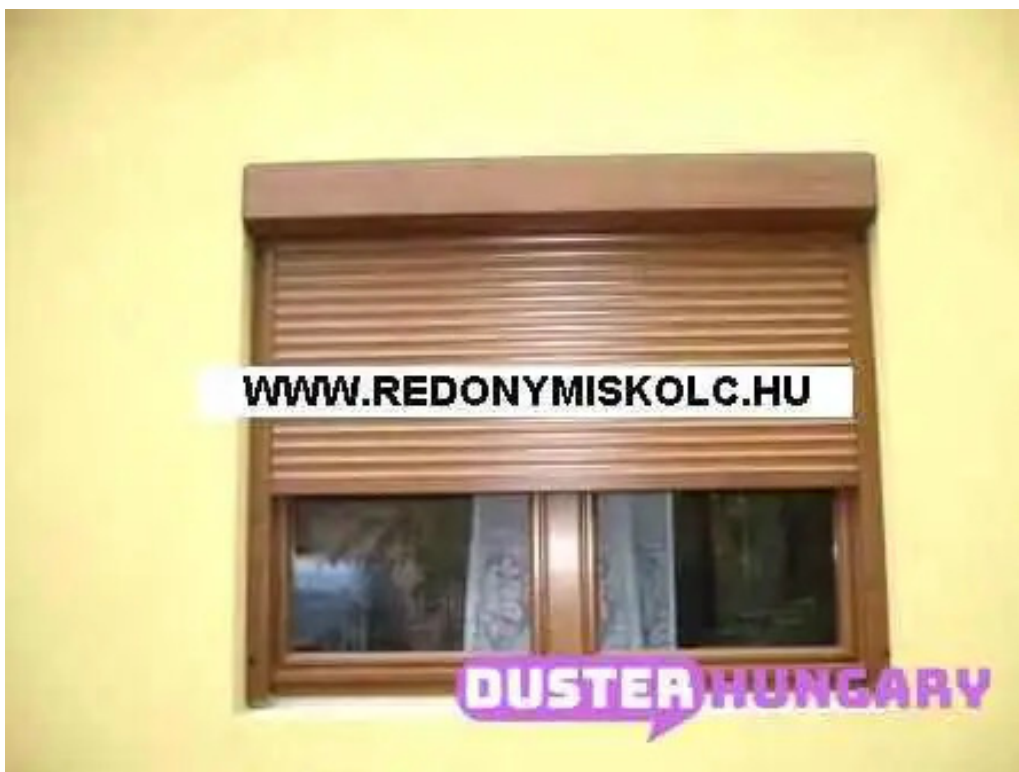
Liptak arnyekolastechnika belul