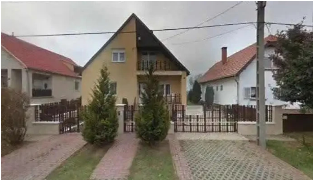
Lipták árnyékolástechnika utcakepek és 360deg