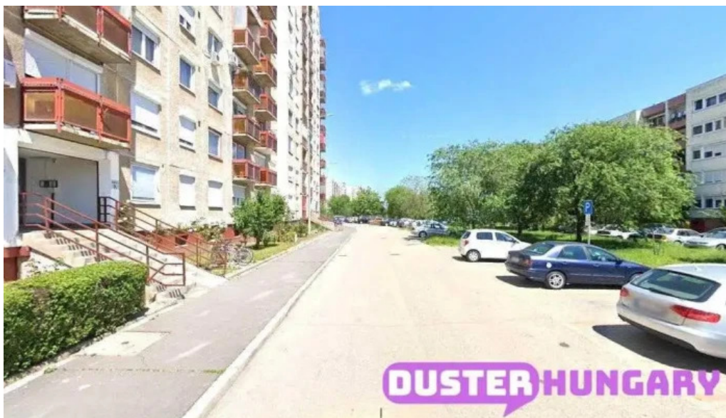
Molnar janos szolnok