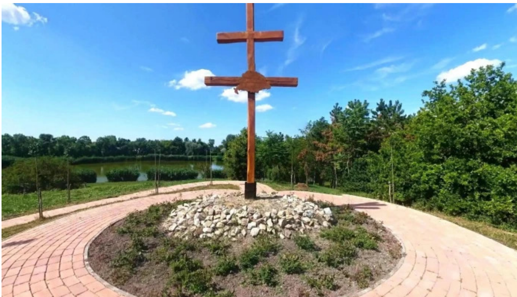
Soponya utcakep es 360deg