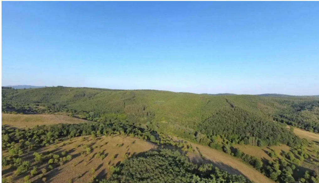
Sirok utcakep es 360deg