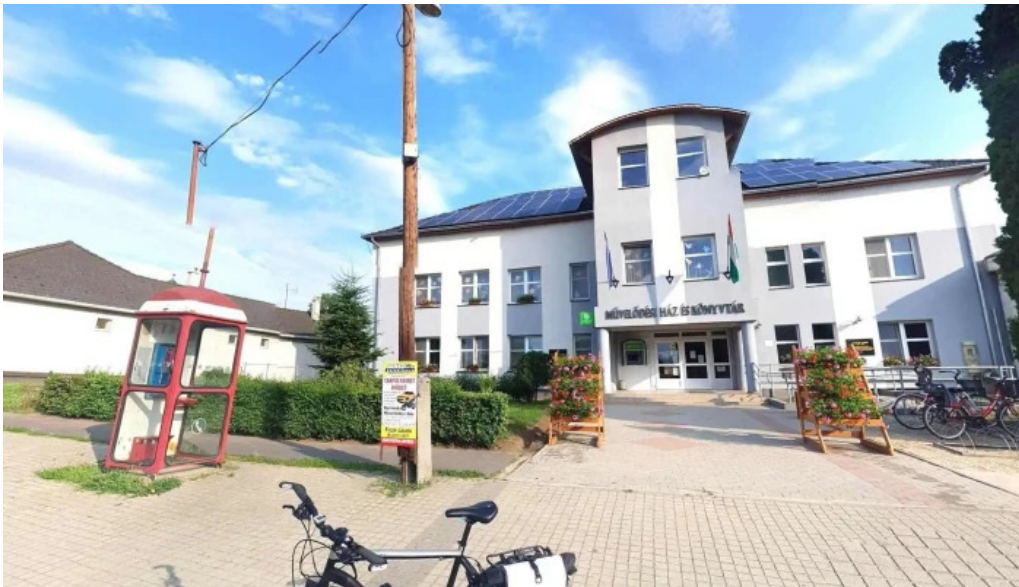
Nyirmada utcakep es 360deg