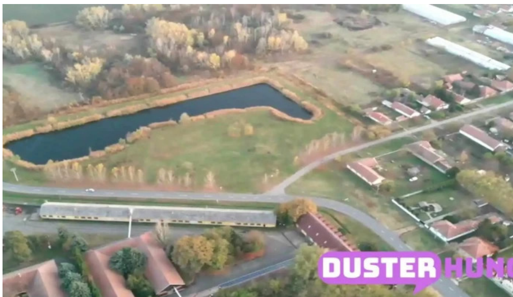
Lukács to összes