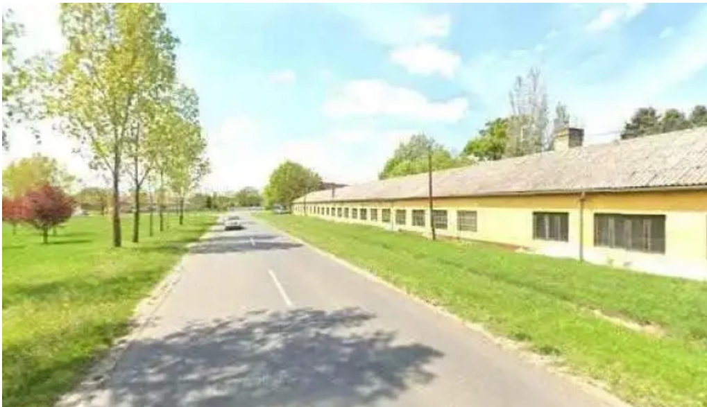
Lukacs to utcakep es 360deg