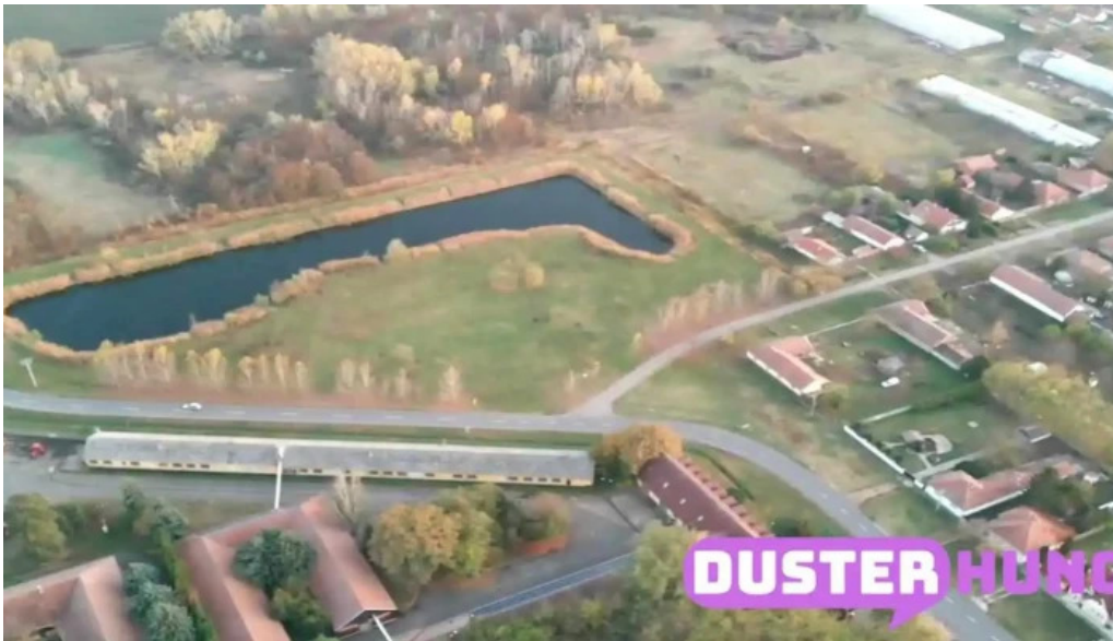
Lukacs to ketegyhaza