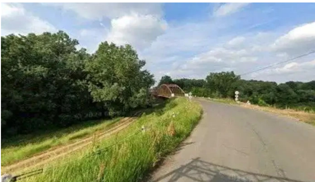
Mezőberenyi kettős koros hid osszes