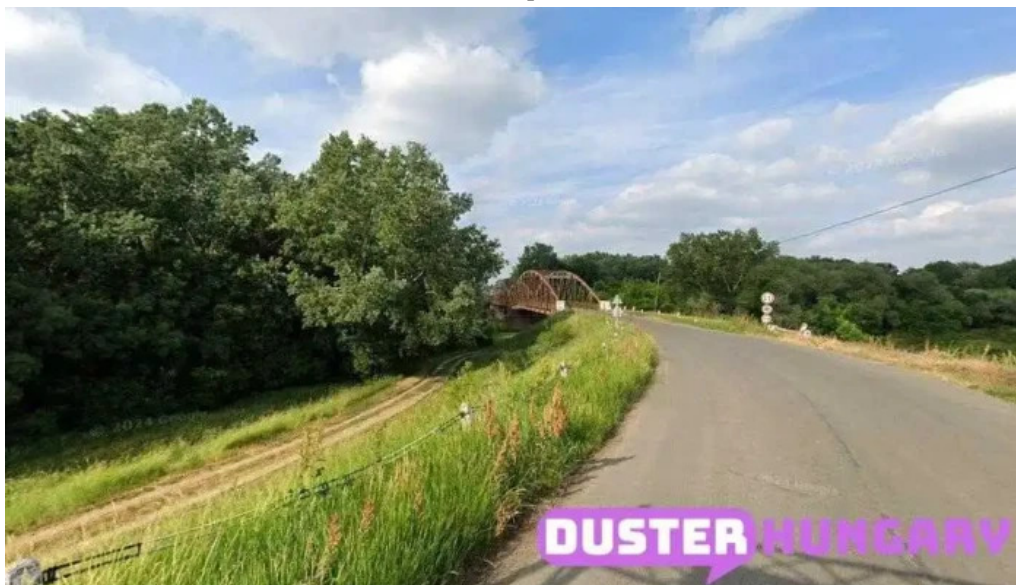
Mez?berényi kett?s koros hid mez?bereny