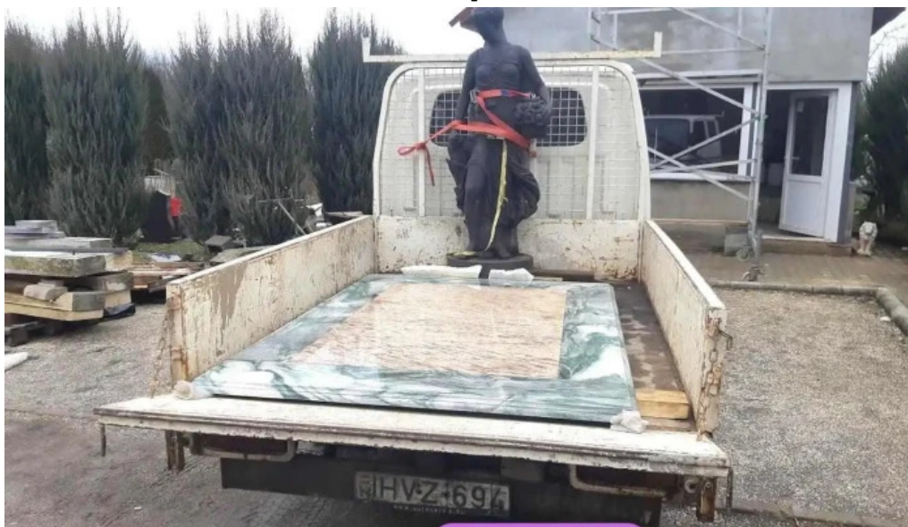
Rozinka attila marvany es granit kereskedelem nyirpazony