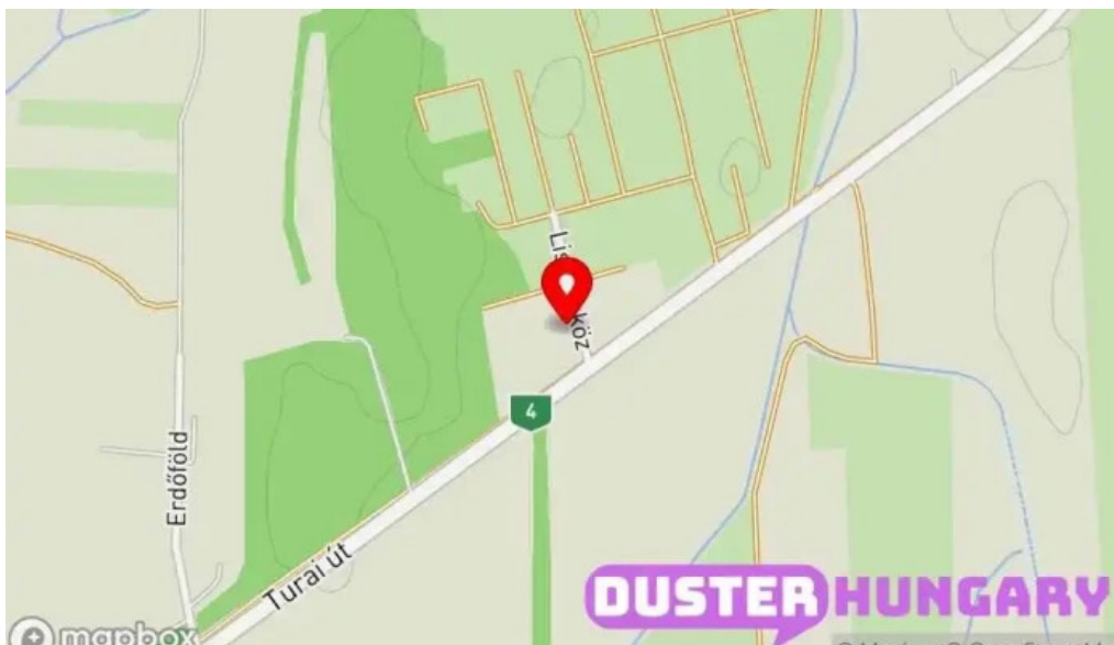
Rozinka attila marvany es granit kereskedelem térkép