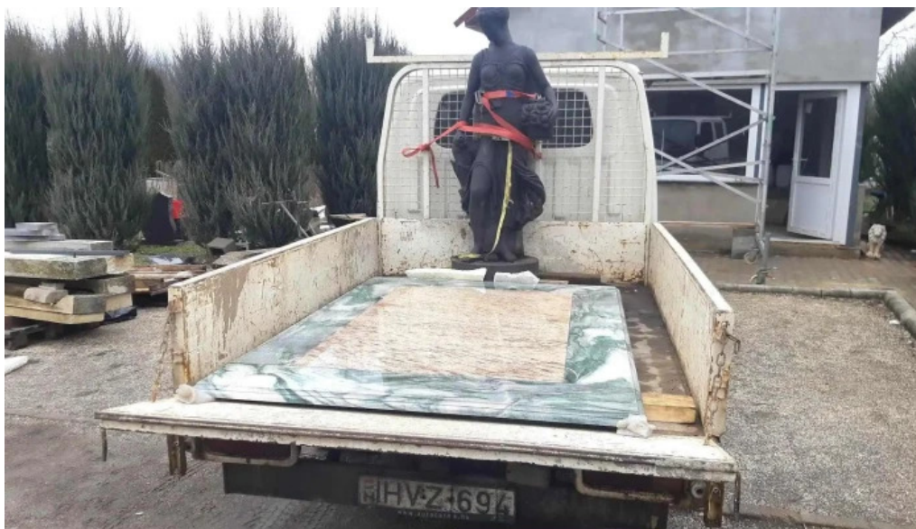
Rozinka attila marvany es granit kereskedelem osszes