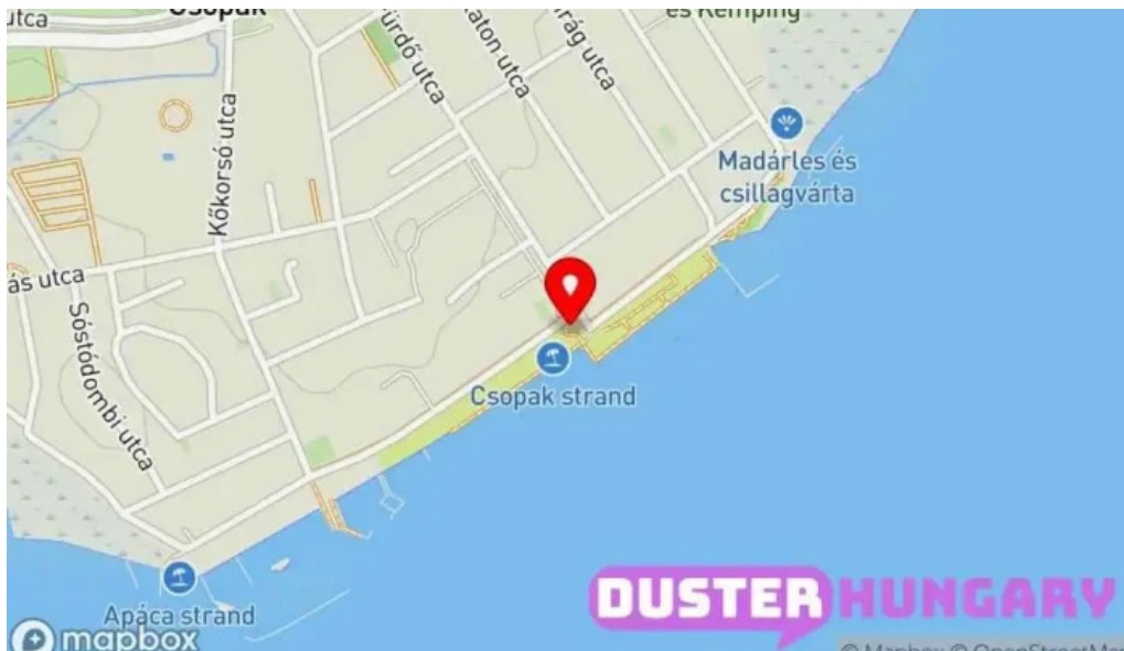
Csopak strand térkép