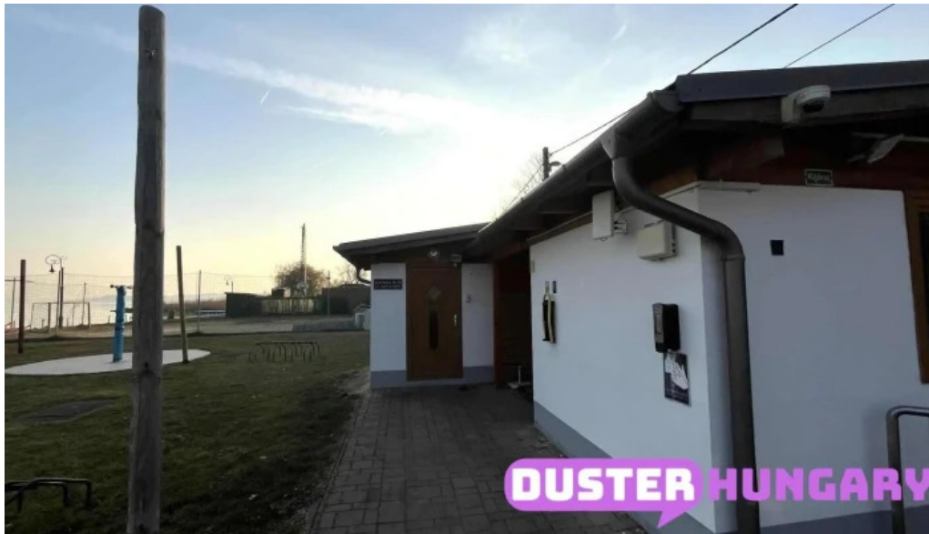
Csopak strand legfrissebb