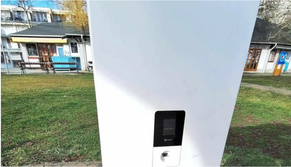
Csopak strand hogyan lehet odajutni