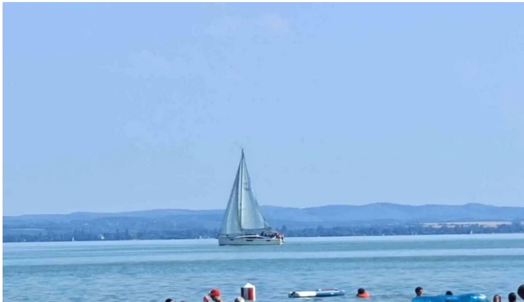
Csopak strand kedvezmenyek