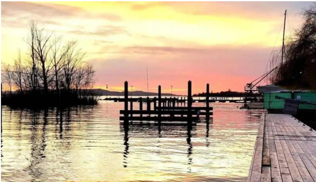
Csopak strand osszes