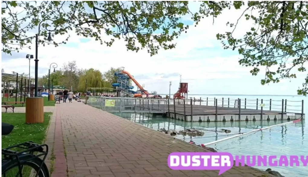
Csopak strand videok