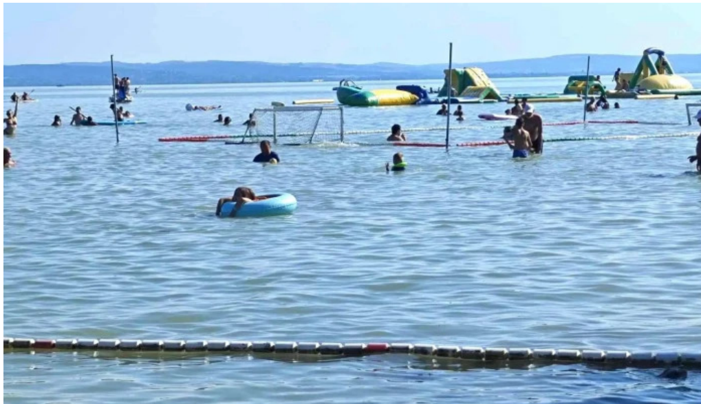
Csopak strand telefon