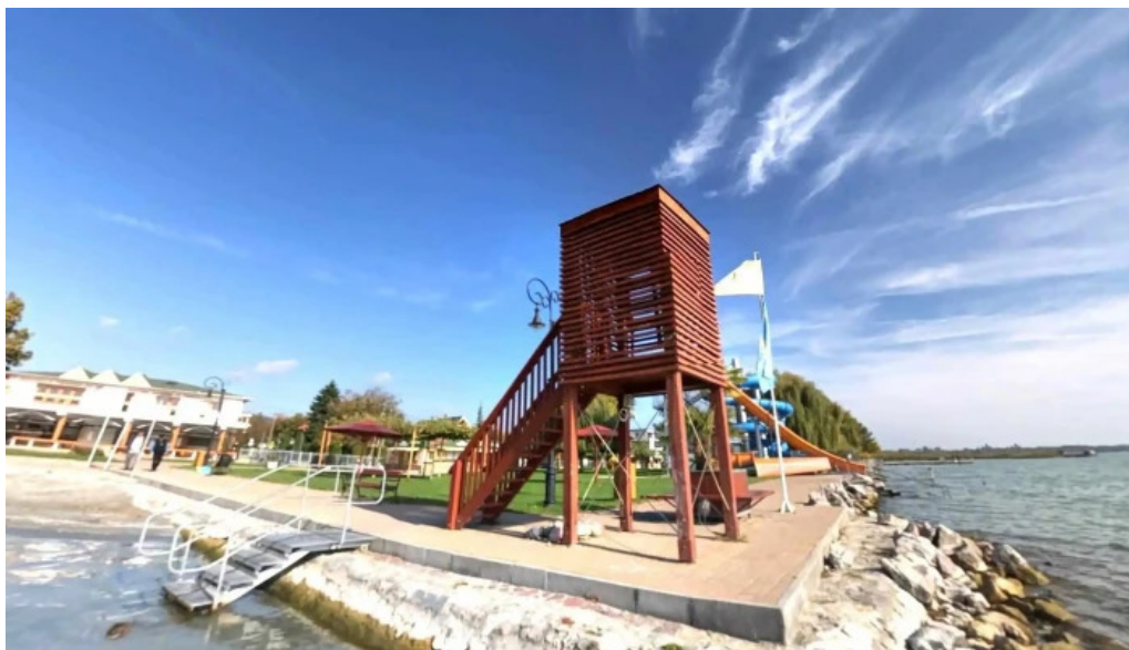
Csopak strand utcakep es 360deg