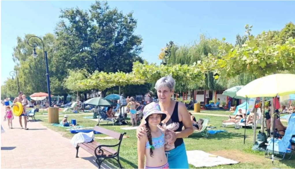
Csopak strand szam