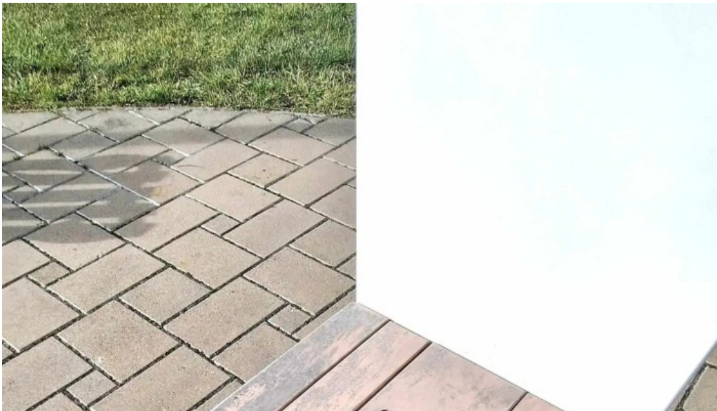
Csopak strand csopak