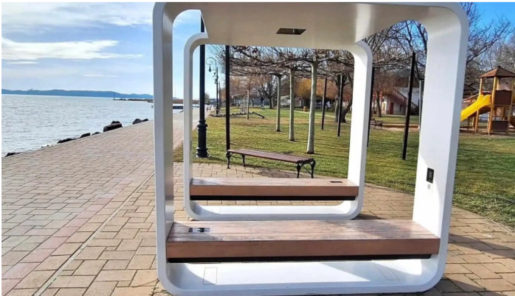
Csopak strand furd?