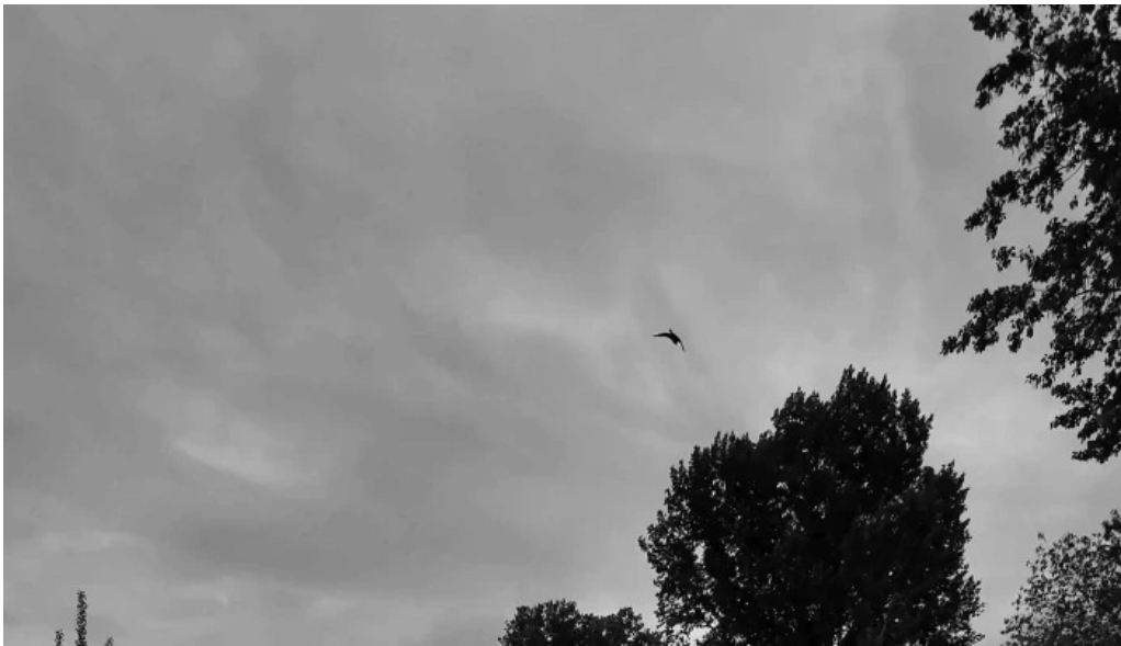
Zamolyi csatorna gy?rzamoly