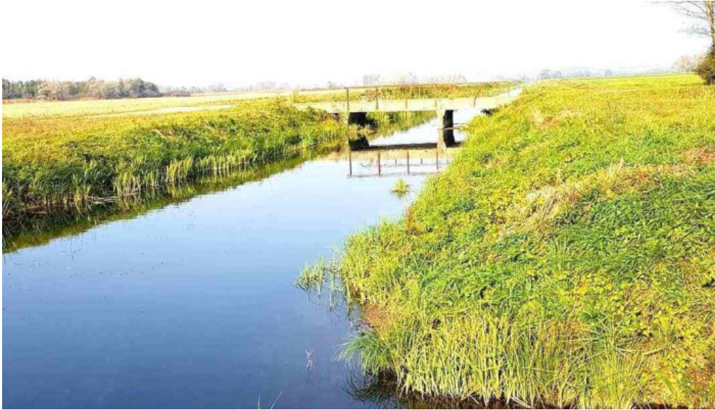
Zamolyi csatorna összes