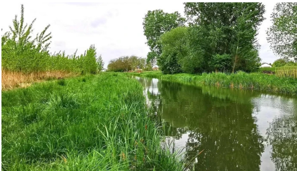
Zamolyi csatorna folyo