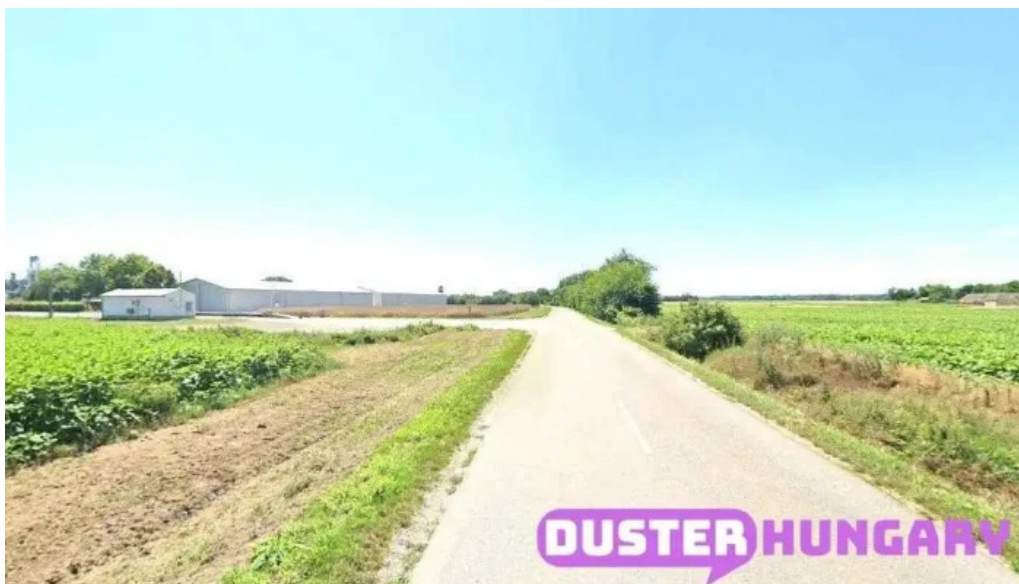
Tolna bogyiszloi ut tolna