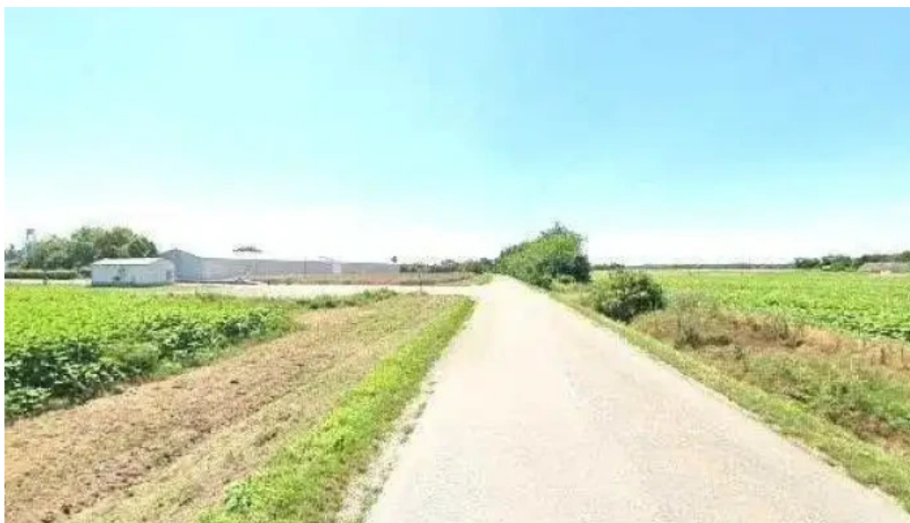
Tolna bogyiszloi ut osszes