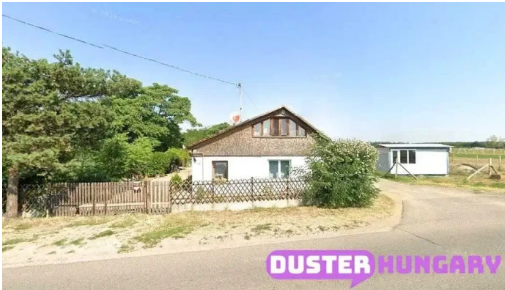
Lakatos d?l? tiszakecske