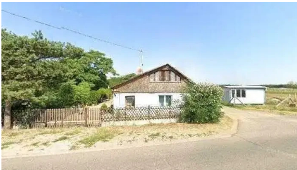
Lakatos dulo osszes