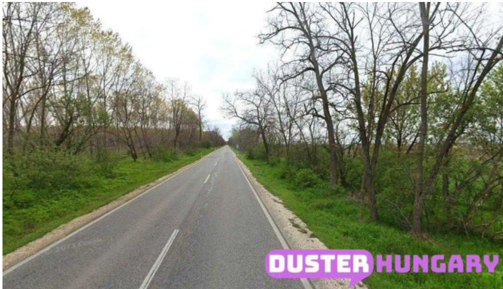
Szentmartonkata forropusza termel?szovetkezet bejarati ut szentmartonkata