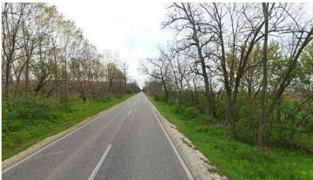
Szentmartonkata forropuszta termeloszovetkezet bejarati ut osszes