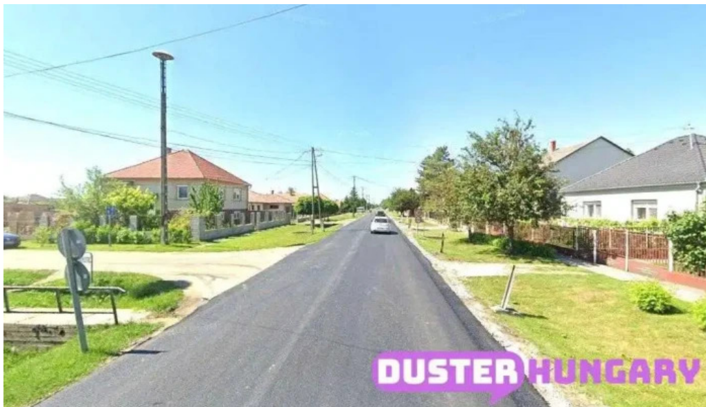
Rabapatona vízműtelep rabapatona