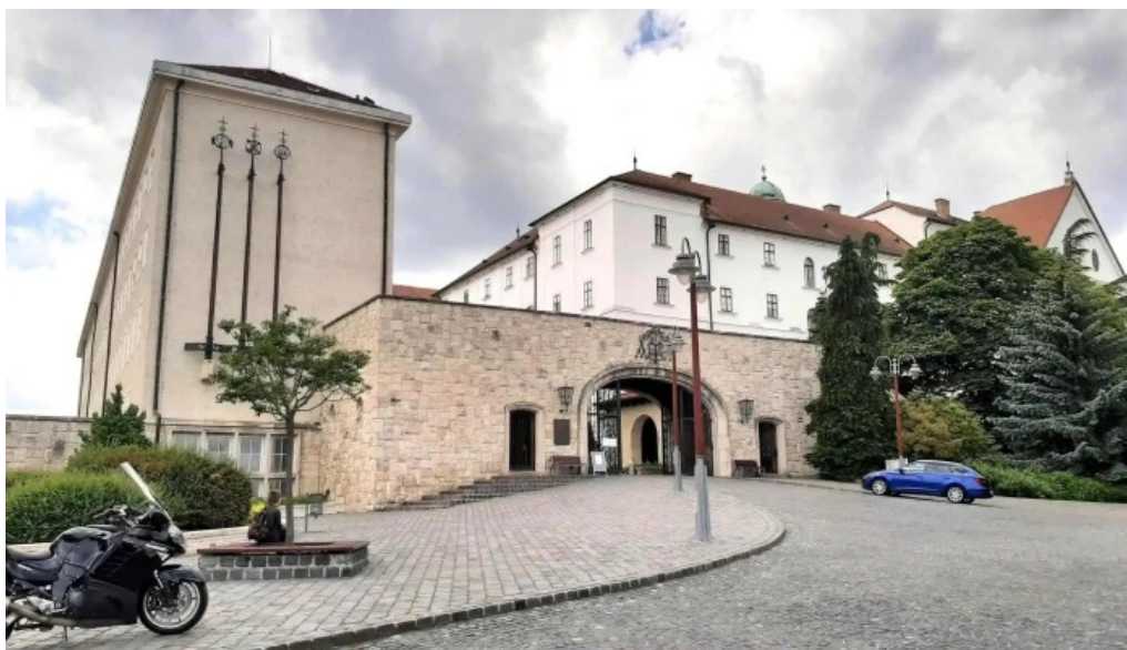
Pannonhalma var fokapu osszes