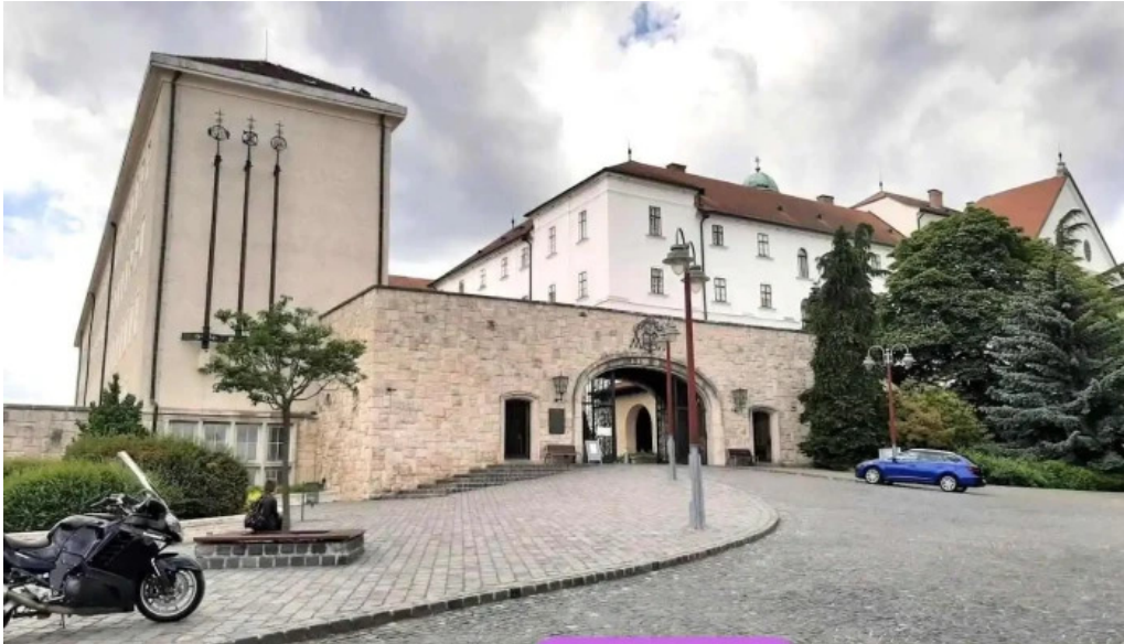
Pannonhalma var f?kapu pannonhalma