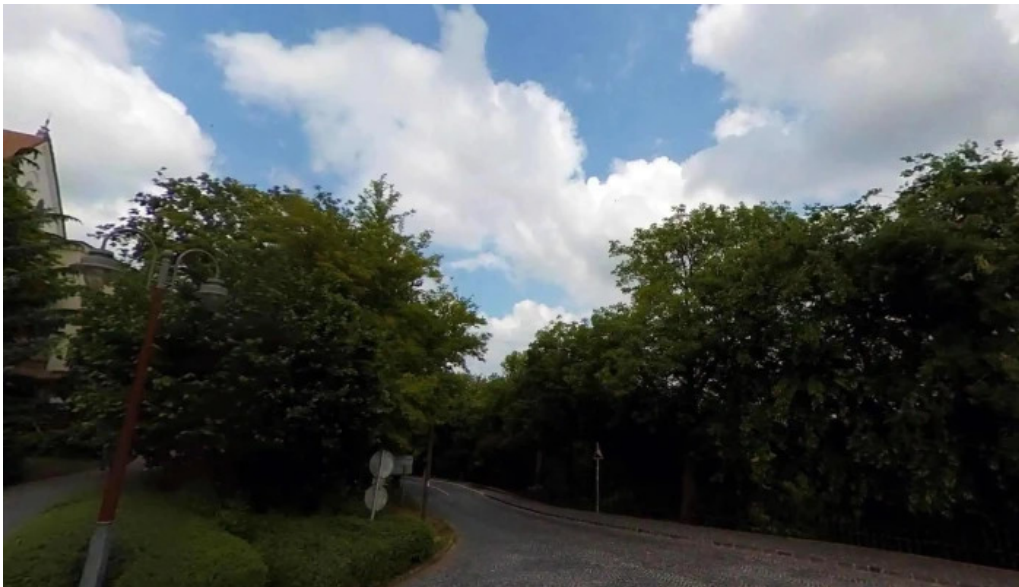
Pannonhalma var fokapu utcakep es 360deg