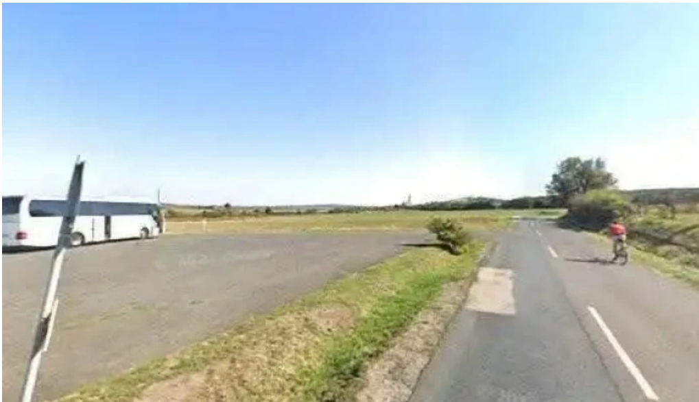
Nemesvamos balacapuszta összes