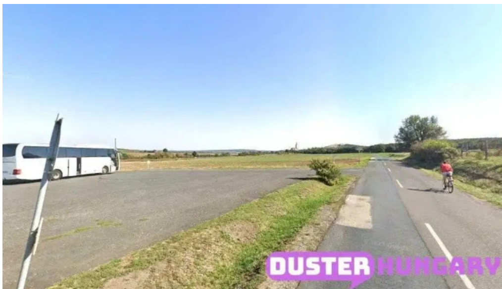
Nemesvamos balacapuszta nemesvamos