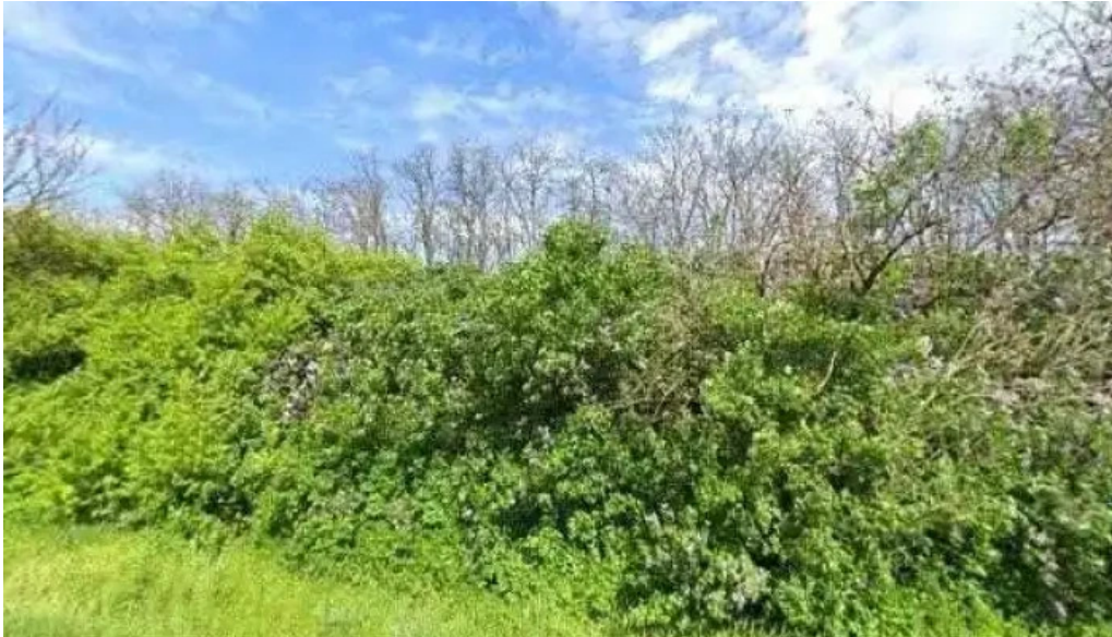
Nagyszénas katyan dulo osszes