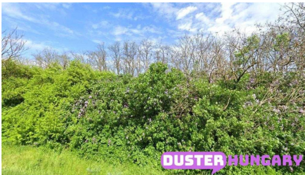
Nagyszenas katyan d?l? nagyszenas