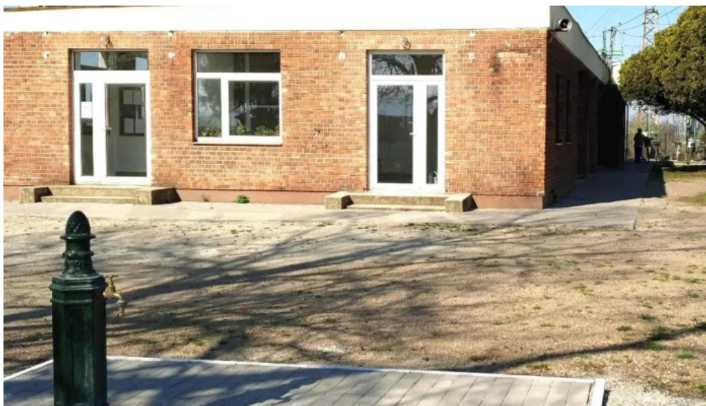
Mezőzombor vasutallomas buszmegallo