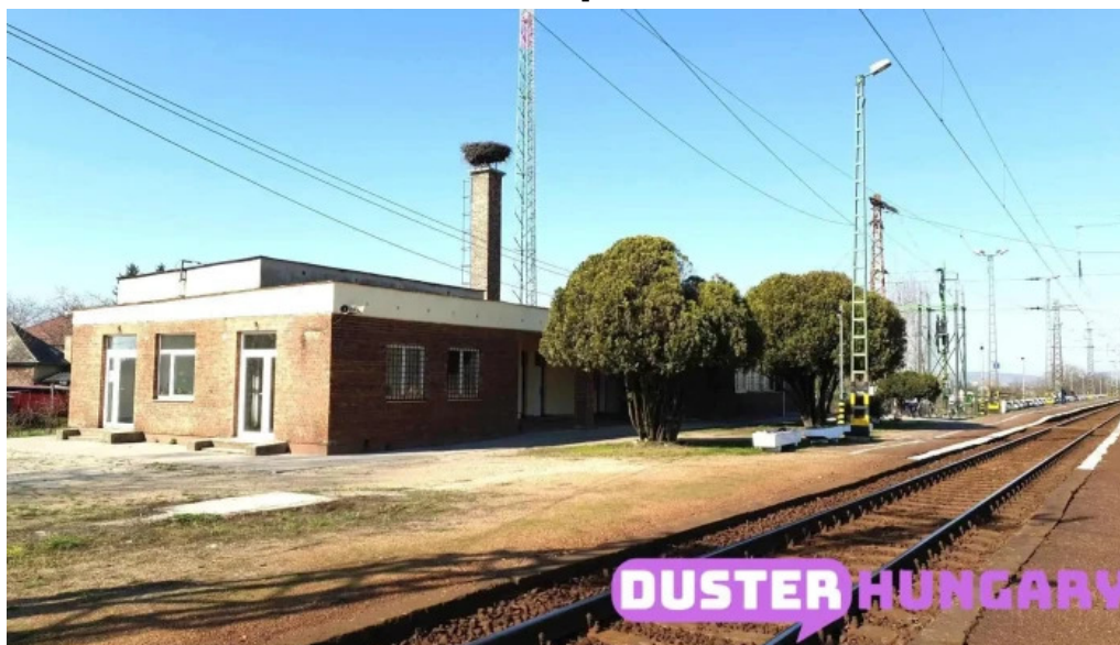
Mezőzombor vasutallomas mez?zombor