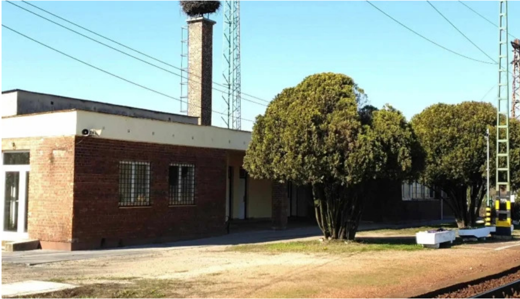
Mezőzombor vasutállomás mezőzombor