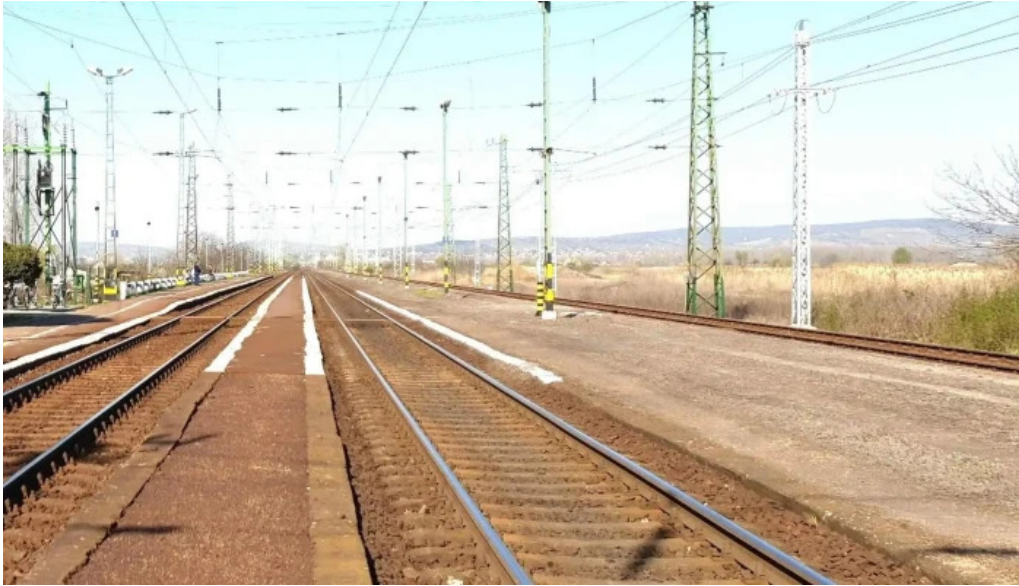
Mezozombor vasutallomas terület