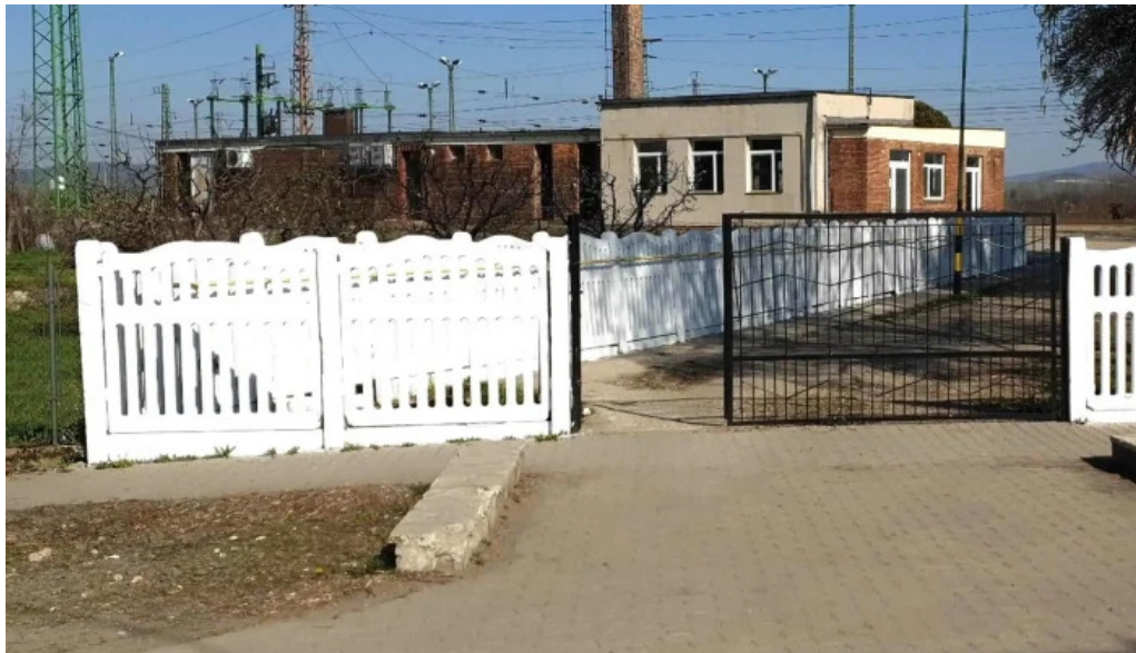
Mezőzombor vasutallomas cim