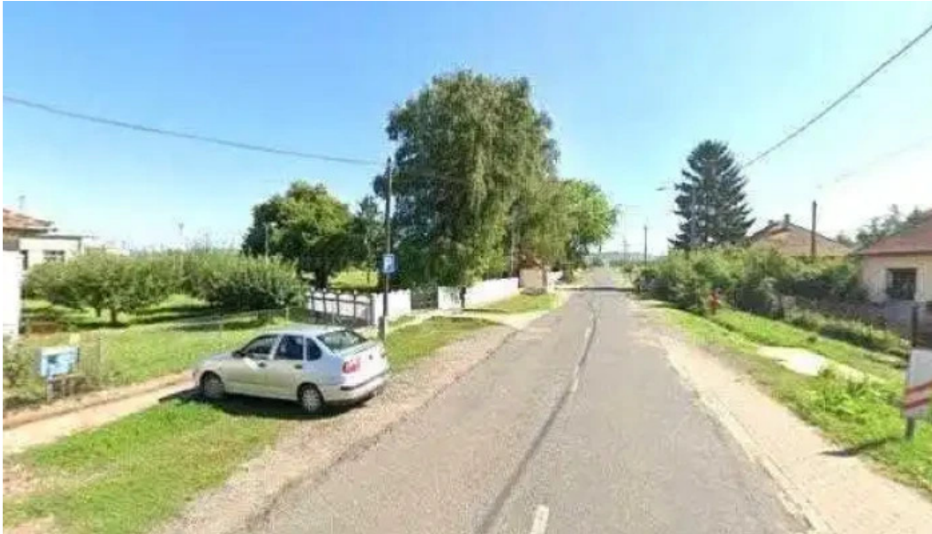
Mezőzombor vasutállomás utcakep es 360deg