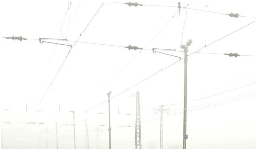
Mezőzombor vasutállomás hogyan lehet odajutni