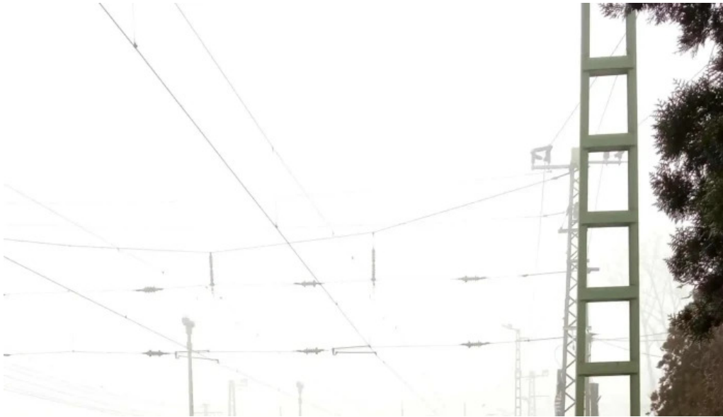
Mezőzombor vasutallomas fotok