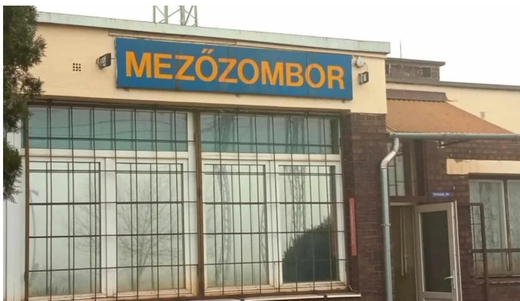
Mezozombor vasutallomas weboldal