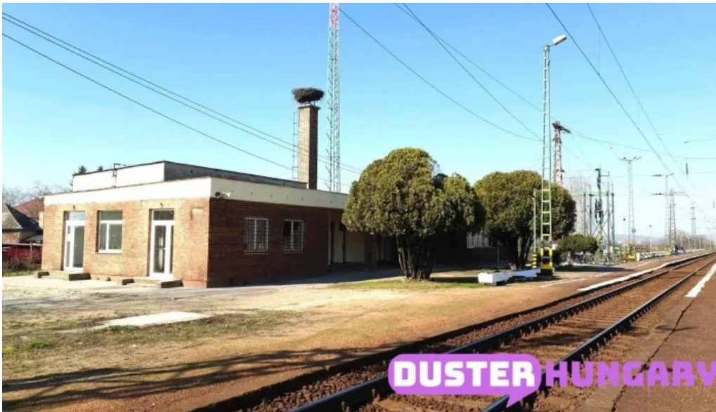
Mezozombor vasutallomas osszes