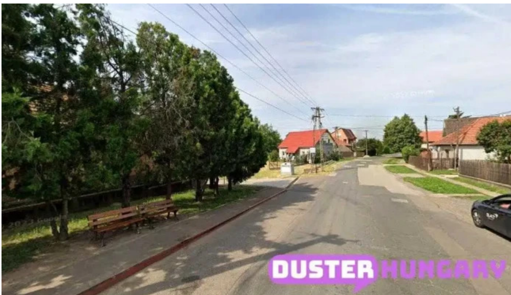
Karacsond községközpont karacsond