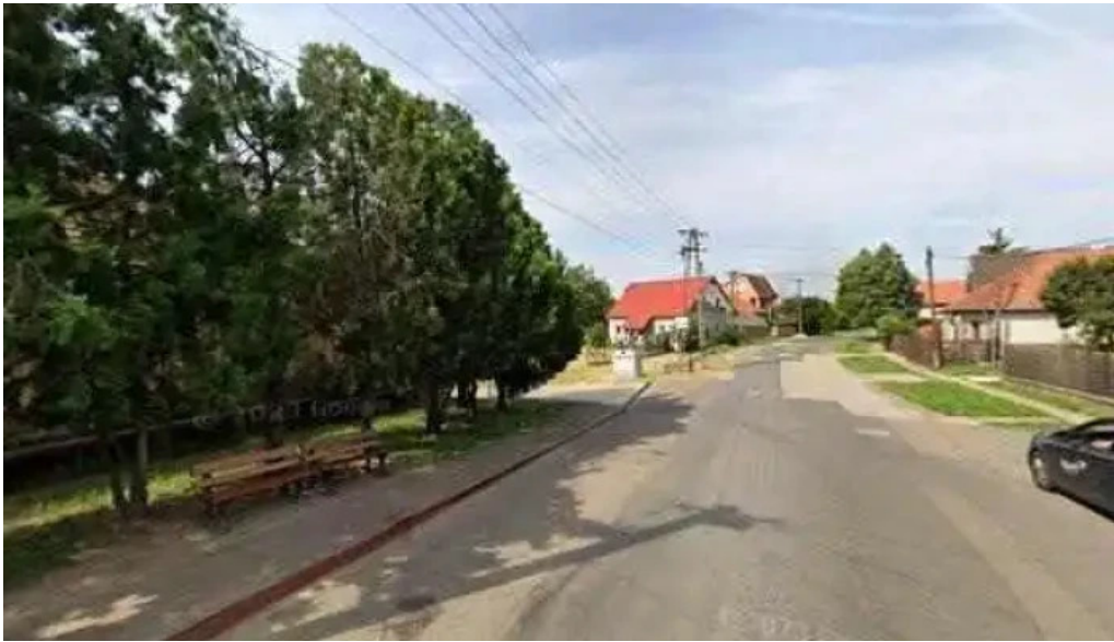
Karacsond községközpont összes