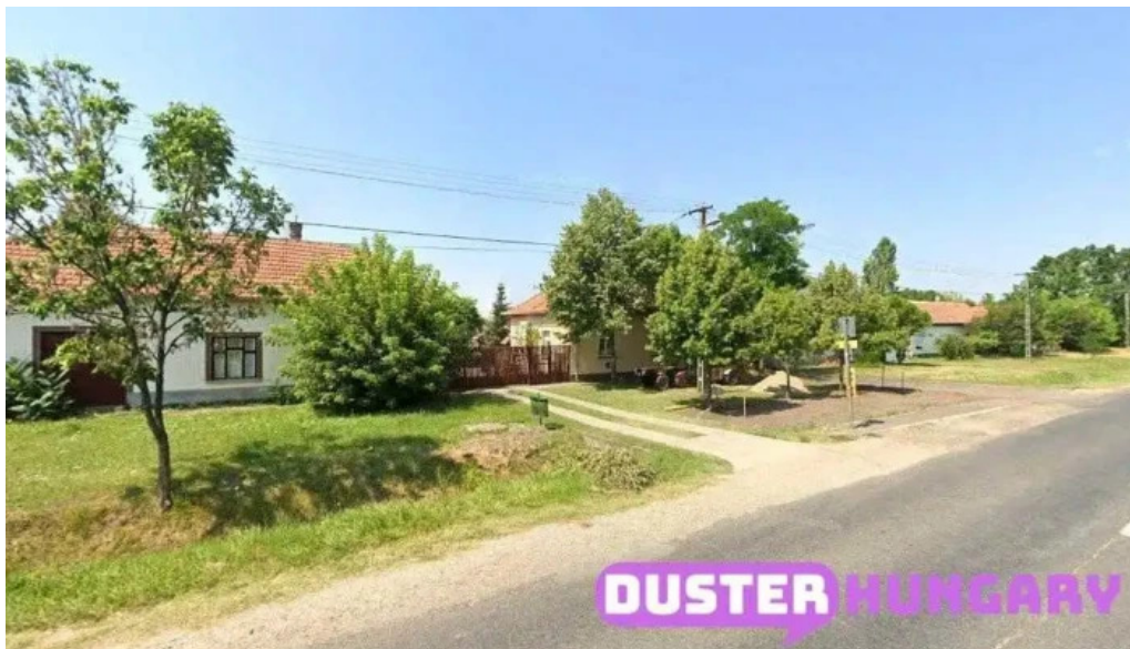
Jászkarajen? malom jászkarajen?