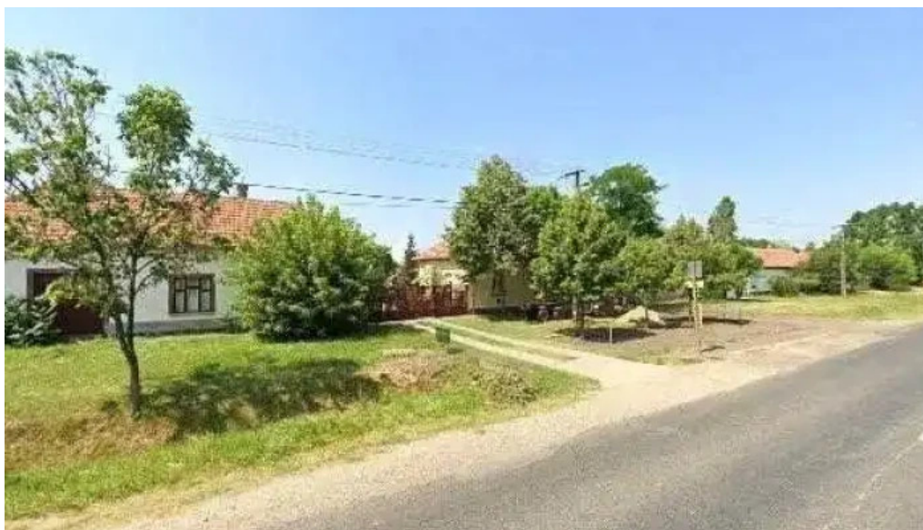
Jászkarajeno malom osszes