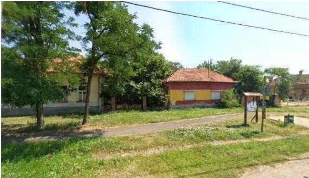
Jaszkarajeno malom osszes