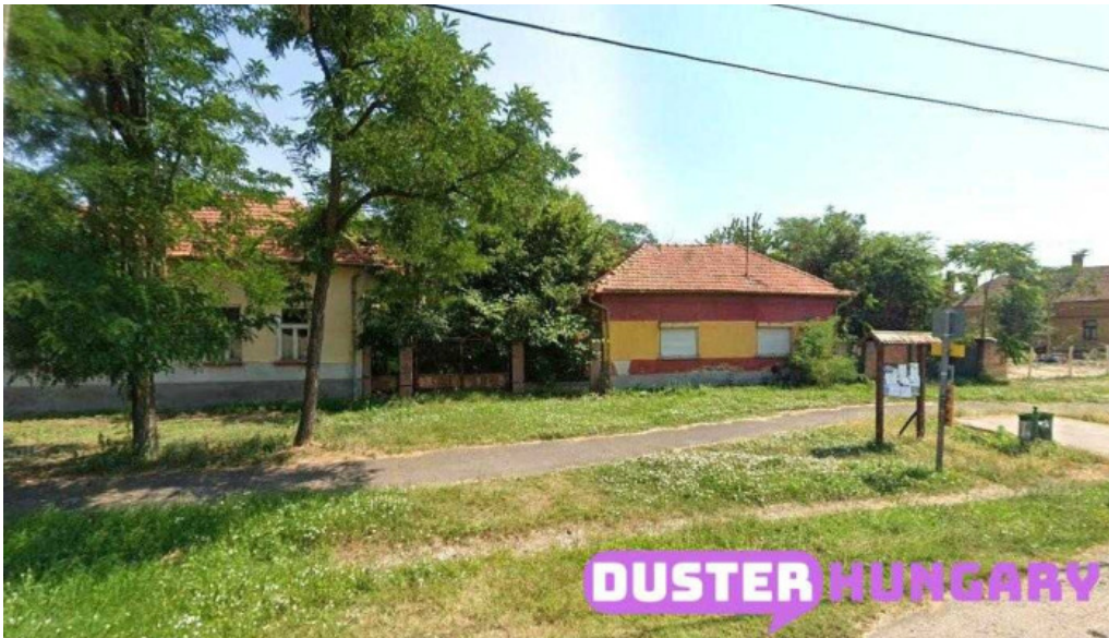
Jászkarajen? malom jászkarajen?