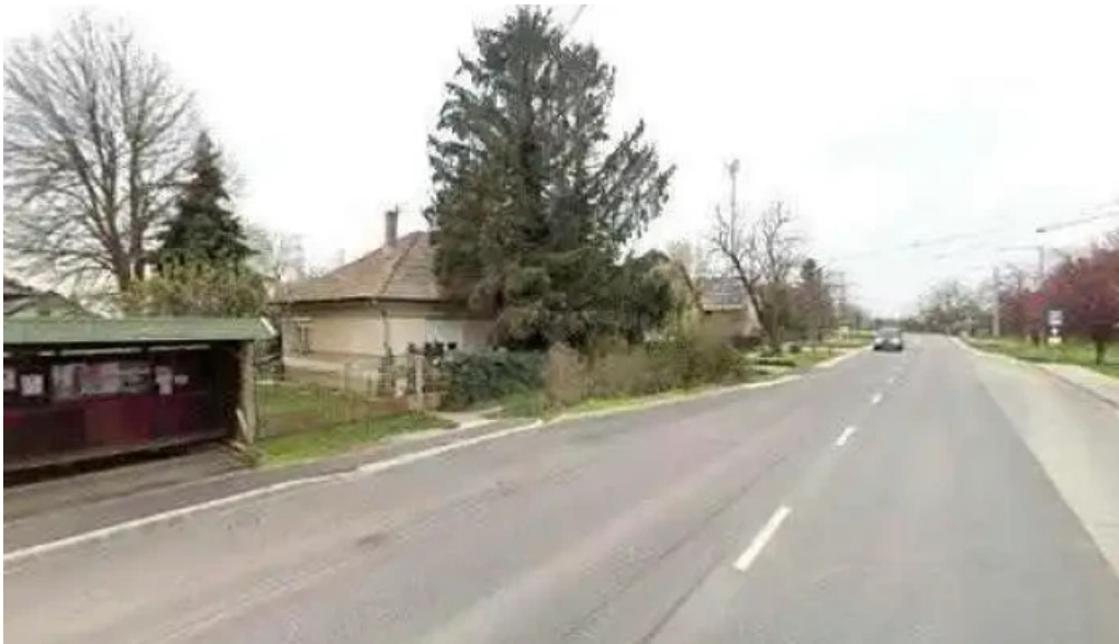
Gomba var ut osszes