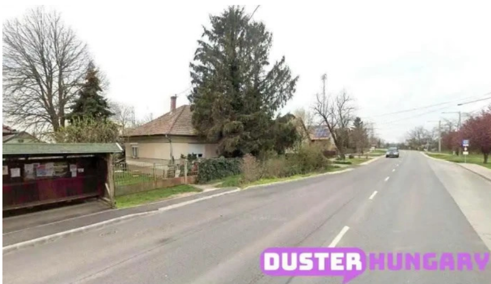
Gomba var ut gomba