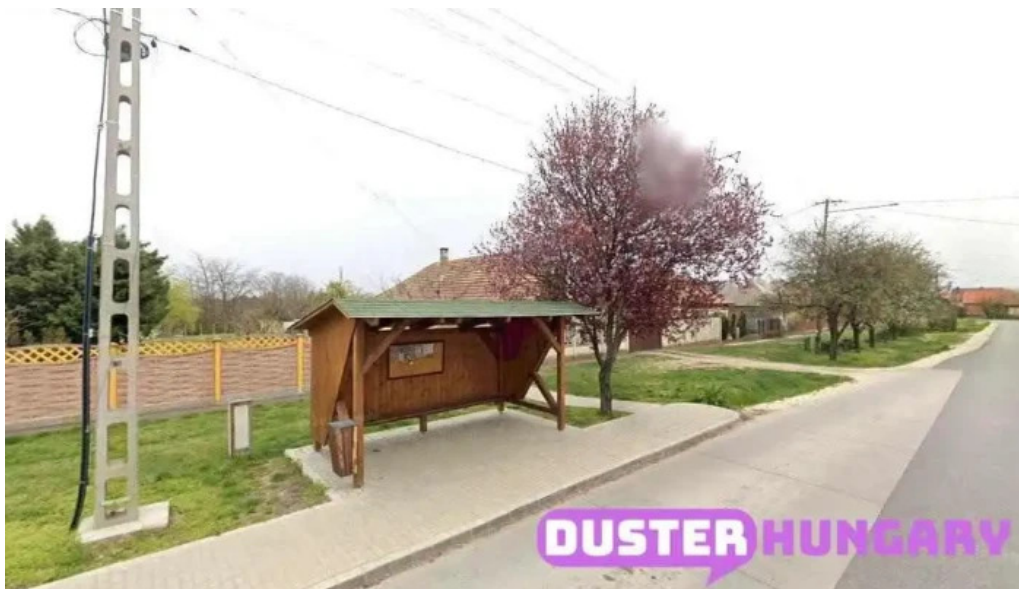
Gomba var ut gomba