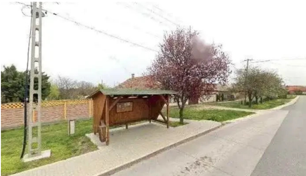
Gomba var ut osszes