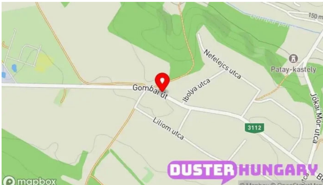
Gomba var ut térkép