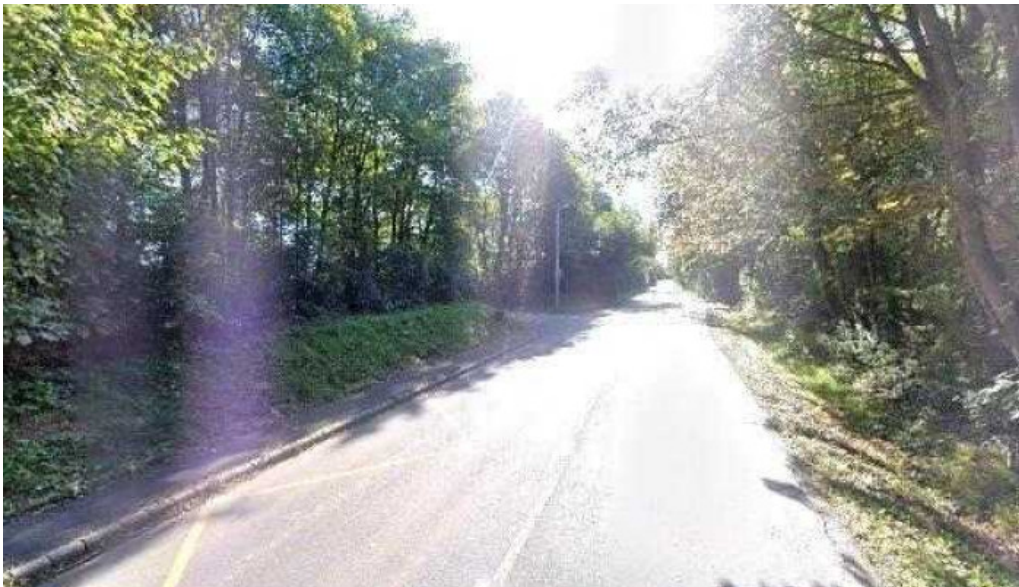
Galgamacsza panorama lakotelep osszes