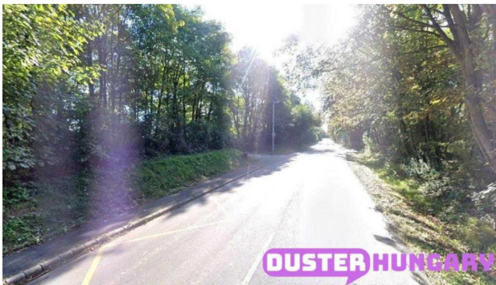
Galgamacsza panorama lakótelep galgamacsza