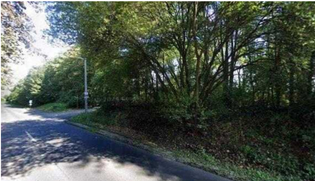
Galgamacsza panorama lakotelep osszes