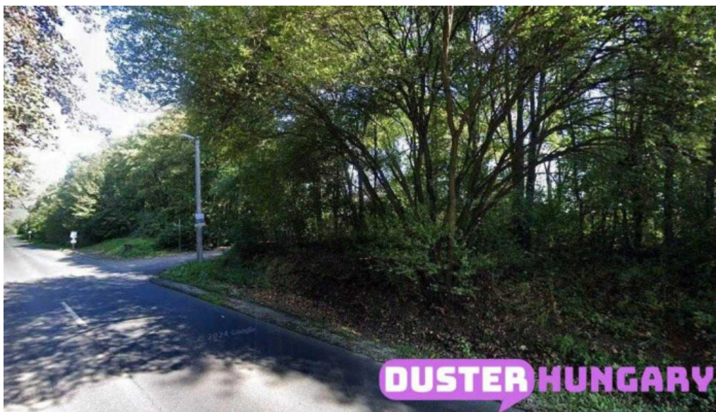
Galgamacsa panorama lakótelep galgamacsa