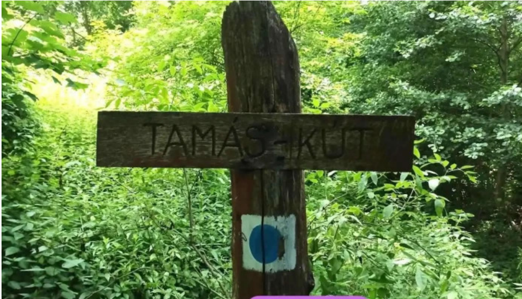
Fels?tarkany tamas kutja fels?tarkany