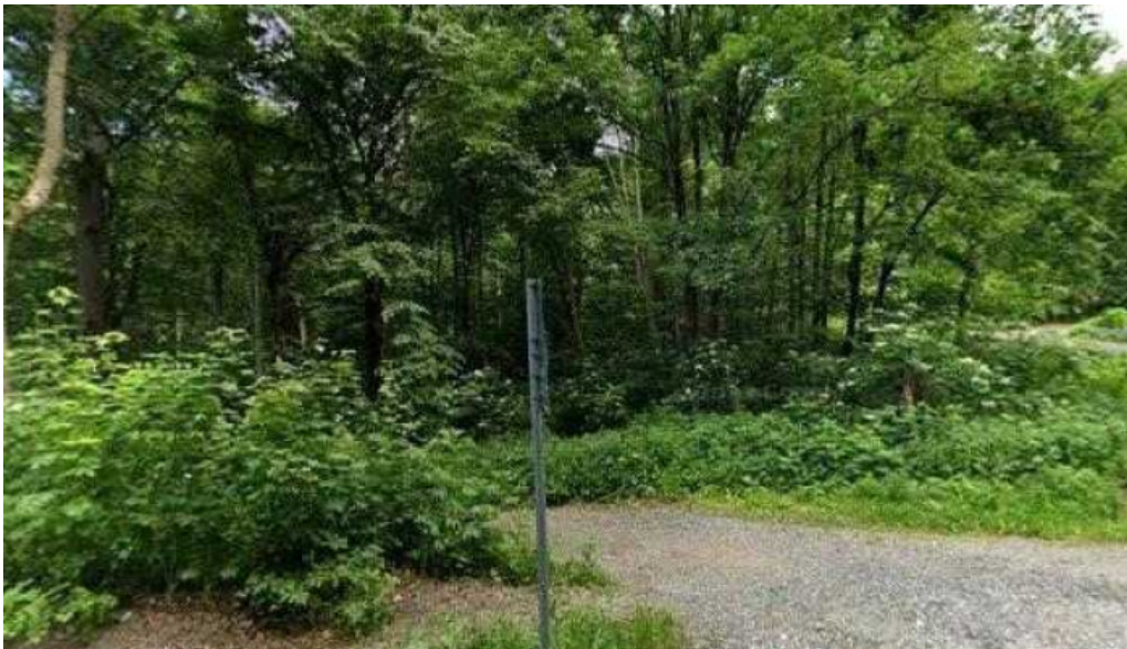
Felsotarkany tamas kutja utcakep es 360deg