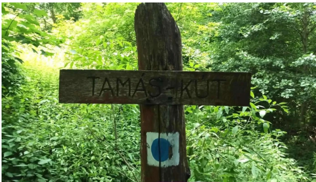
Felsotarkany tamas kutja osszes