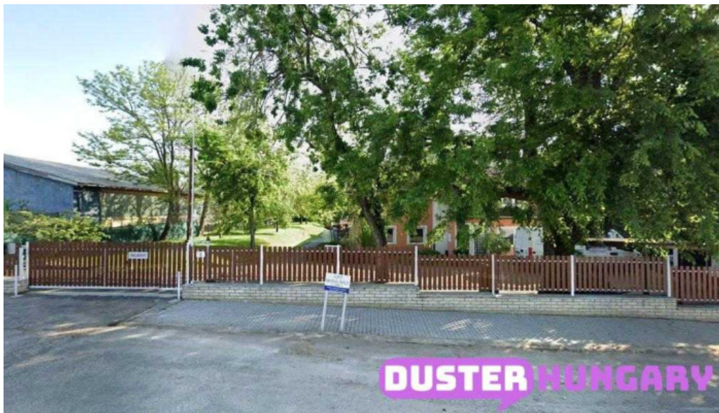
Autofenyez? fot fot