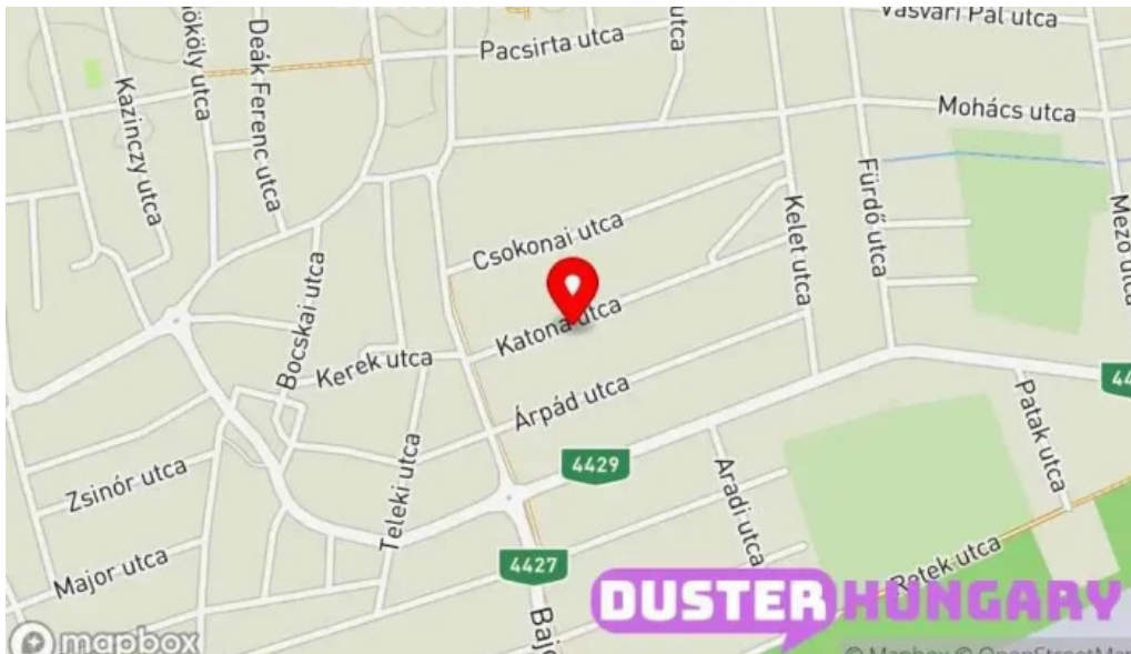
Euro karosszeria bt térkép