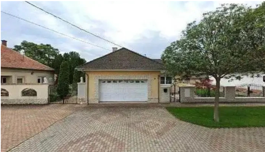
Euro karosszeria bt osszes