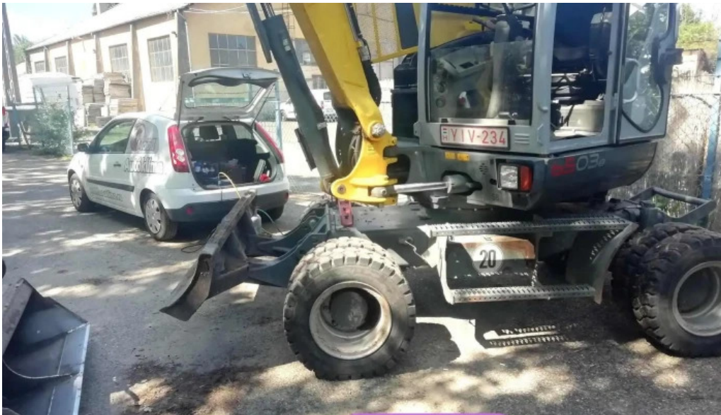
Autoklíma autoszervíz a tulajdonostól