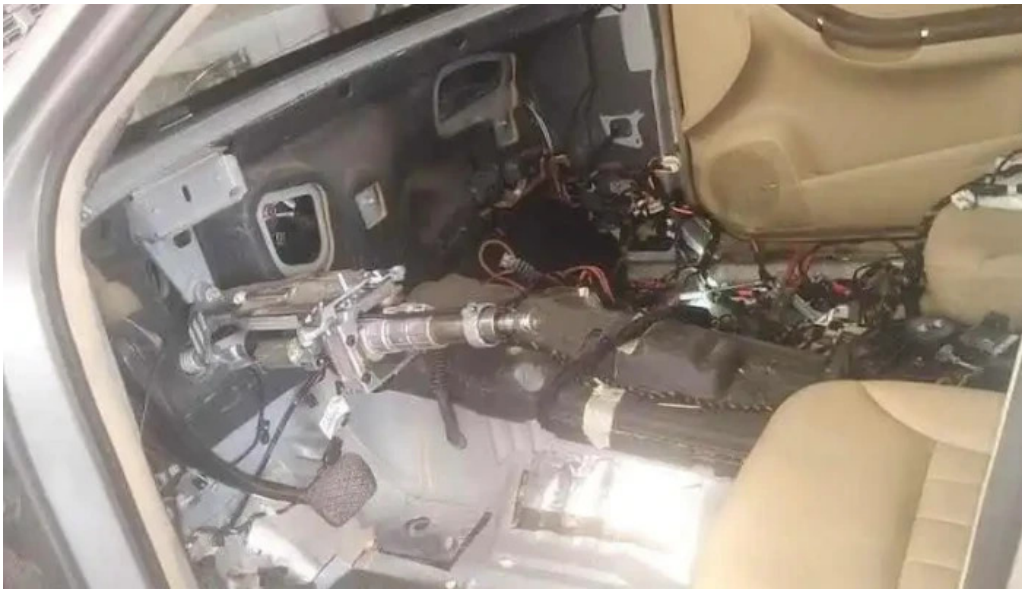
Autoklima autoszerviz kiskunfelegyhaza