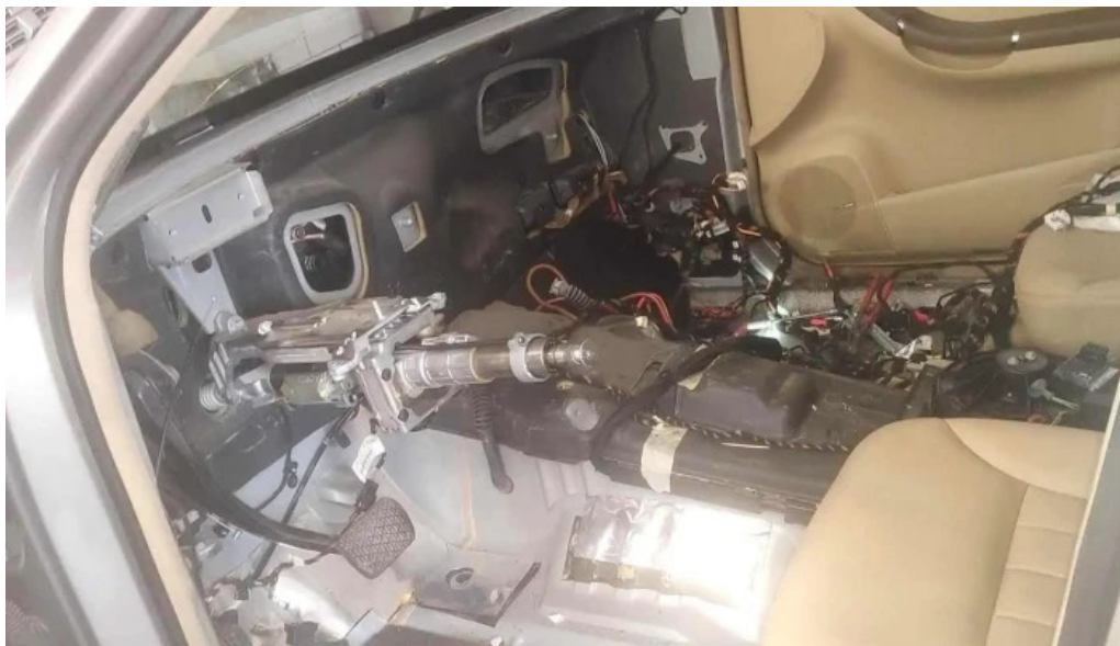
Autoklima autoszerviz összes