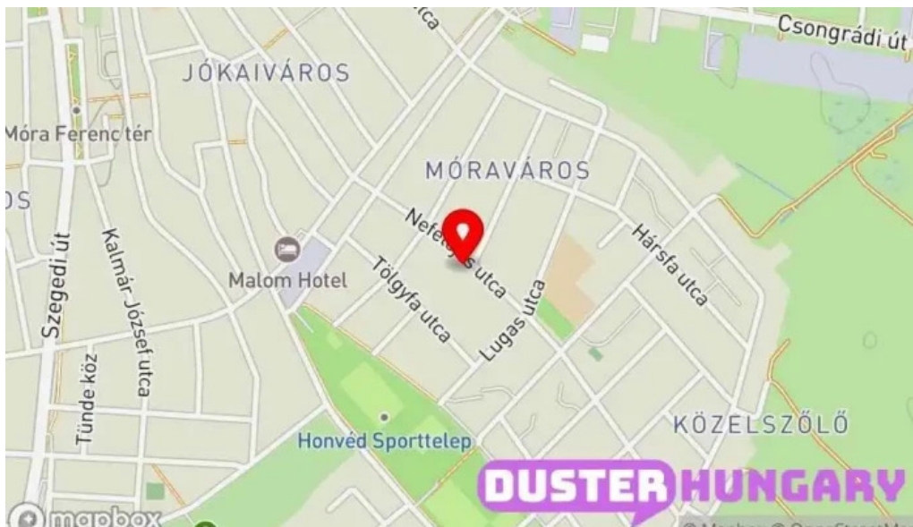
Autoklima autoszerviz térkép