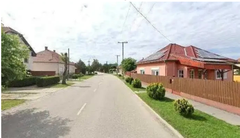
Autoklima autoszervez utcakep es 360deg