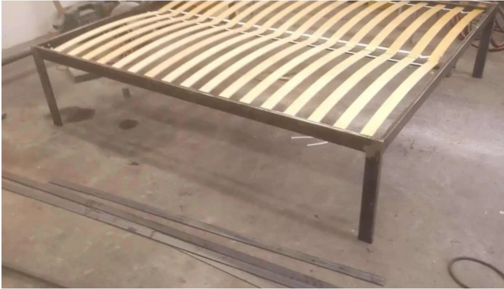
Autoklima autoszerviz muhely