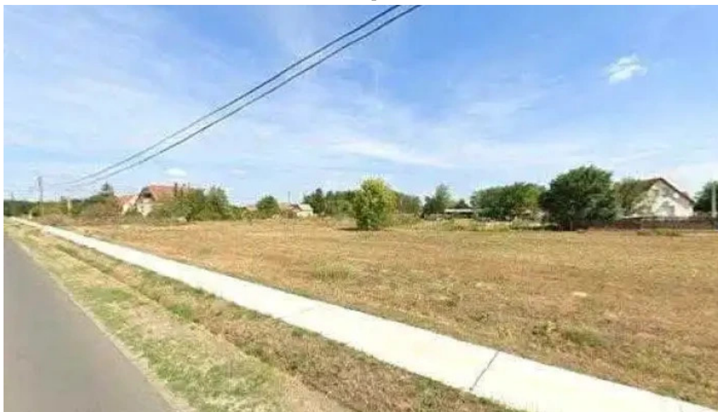
Pribitek autoszerviz helvecia utcakep es 360deg