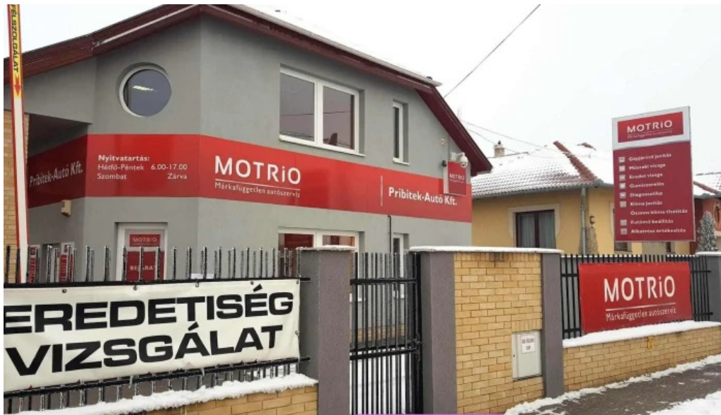
Pribitek autoszerviz helvecia kulso