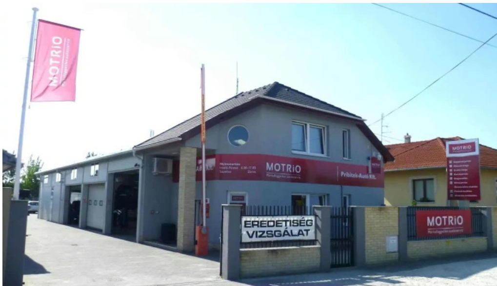
Pribitek autoszerviz helvecia osszes