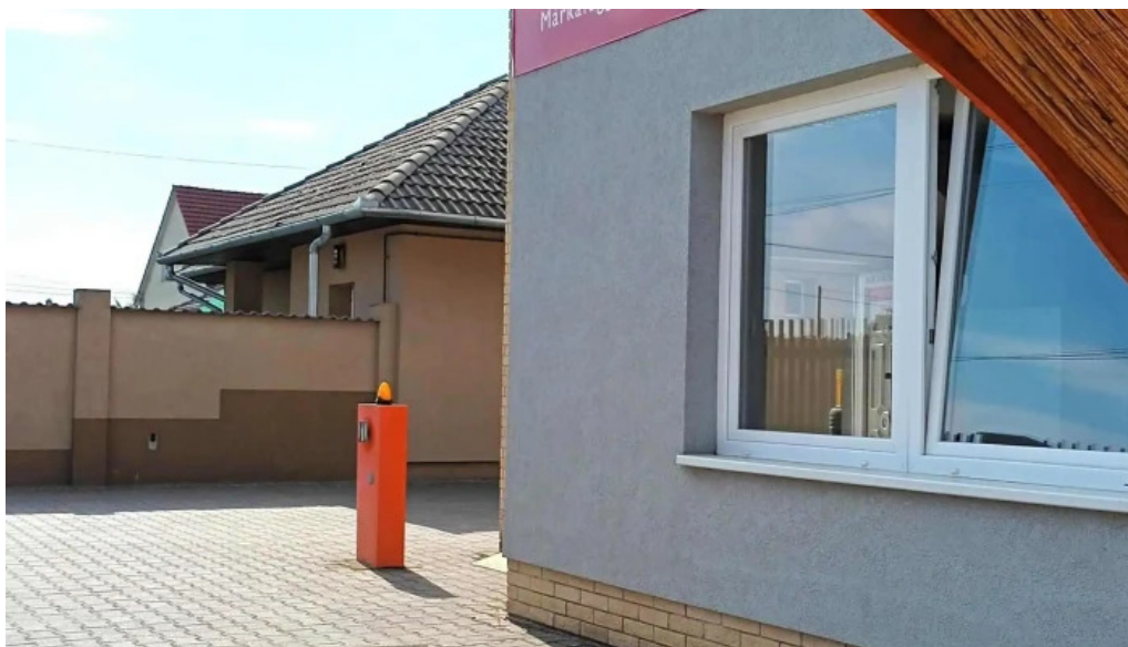
Pribitek autószervez helvecia autojavító