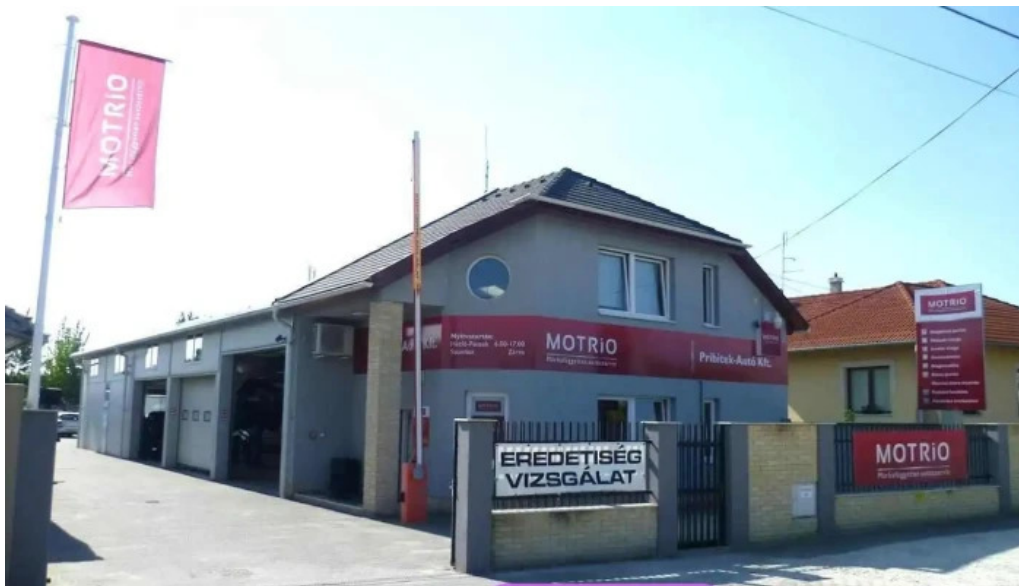
Pribitek autoszerviz helvecia helvecia