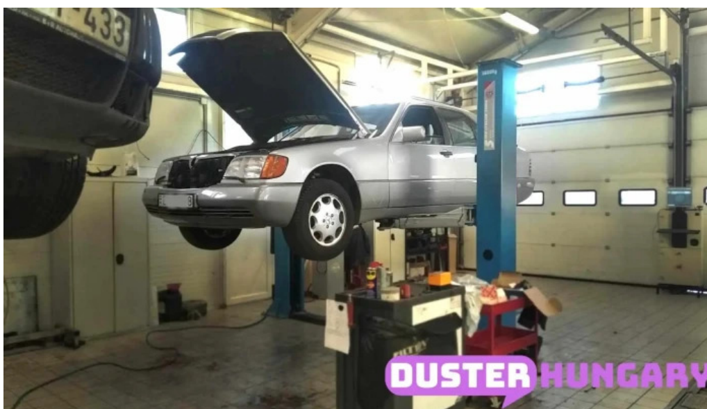
Pribitek autószervez helvecia a tulajdonostól