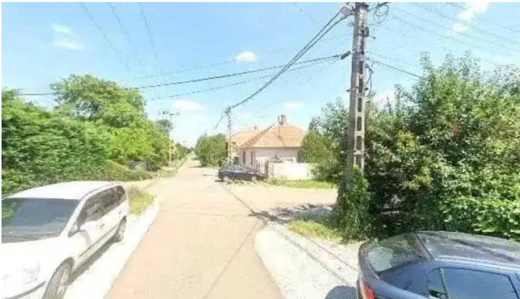
Biro auto autojavito es autosbolt utcakep es 360deg