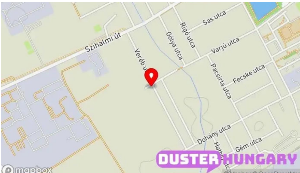
Biro auto autojavito es autosbolt térkép