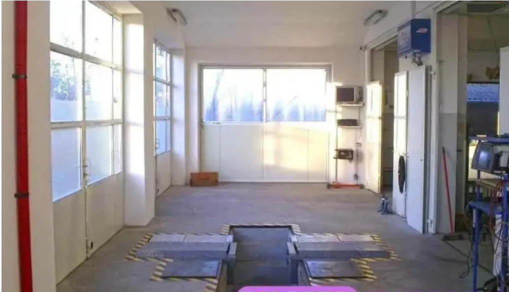
Biro auto autojavito es autosbolt osszes