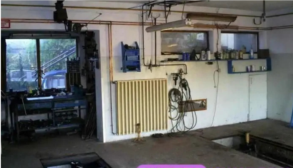
Biro auto autojavito es autosbolt a tulajdonostol