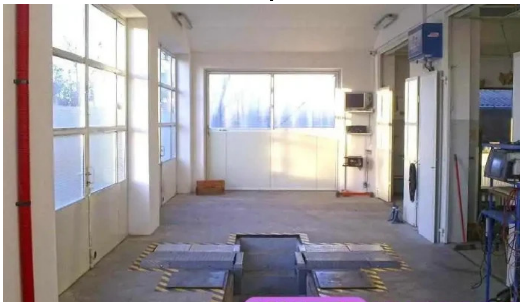
Bíró auto autojavító és autósbolt